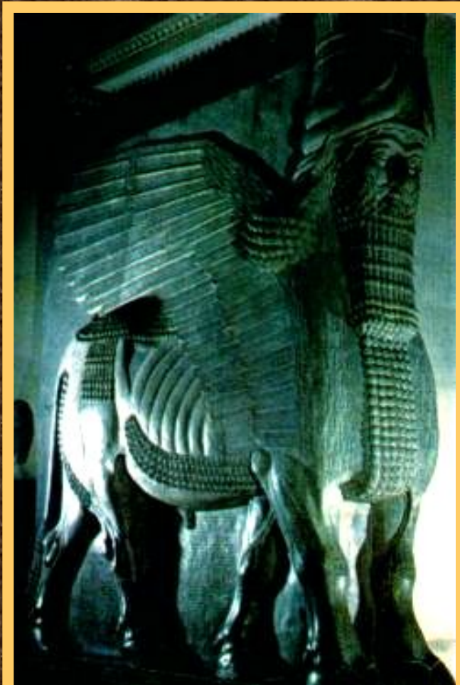
Статуя бога-шеду из дворца Саргона II в Дур-Шаррукине.

При царе Ашшурбанипале была собрана большая библиотека в царском дворце. В ней хранились вавилонские и ассирийские мифы и предания и астрономические трактаты записанные на глиняных табличках. Ассирийцы могли различать светила и созвездия.