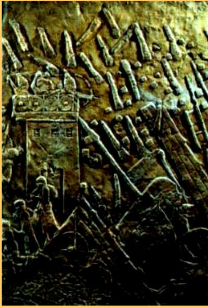
Осада Лахиша. Рельеф из дворца царя в Ниневии

Стены библиотеки украшались барельефами изображавшими подвиги царей.