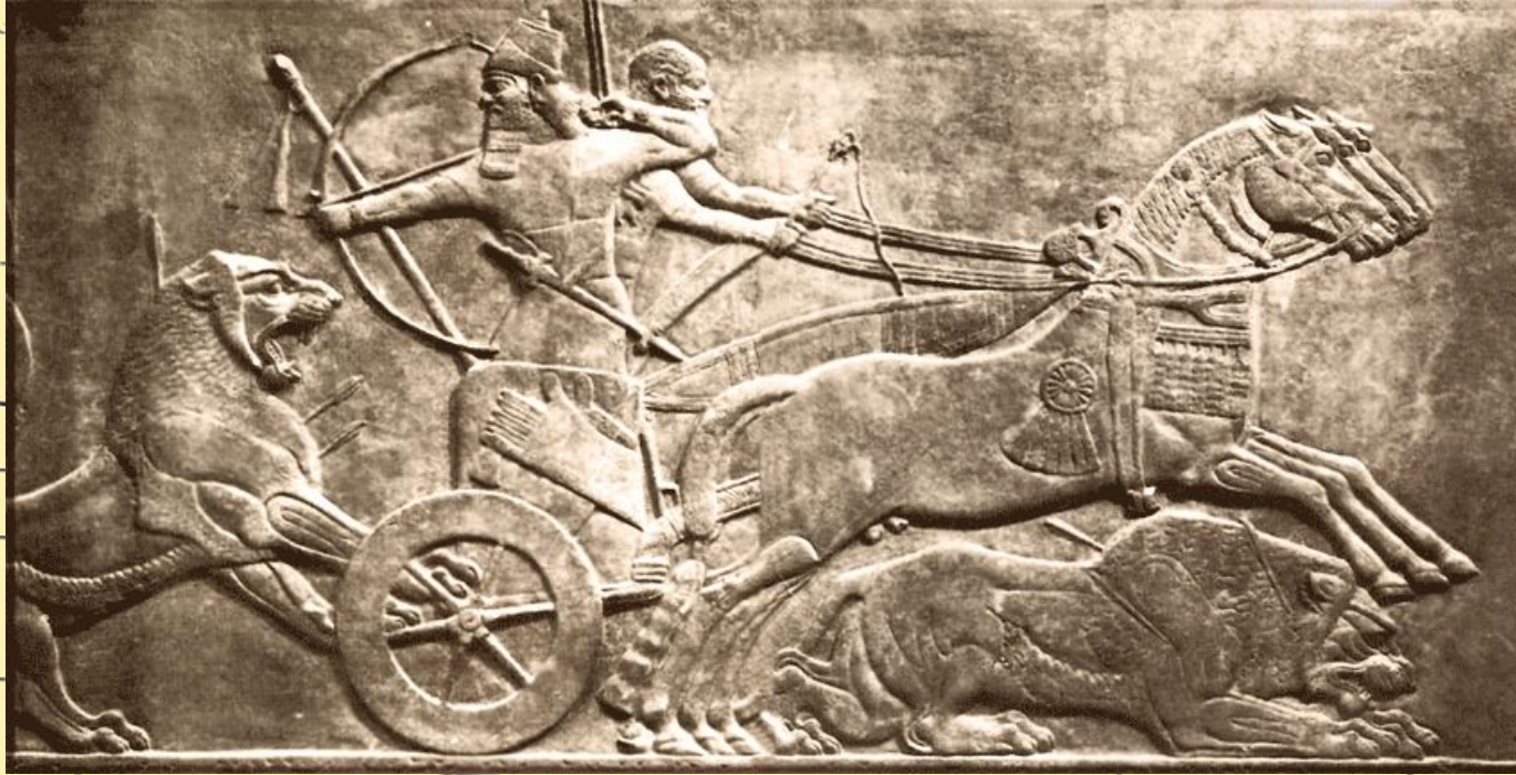
Охота на львов (древний барельеф)