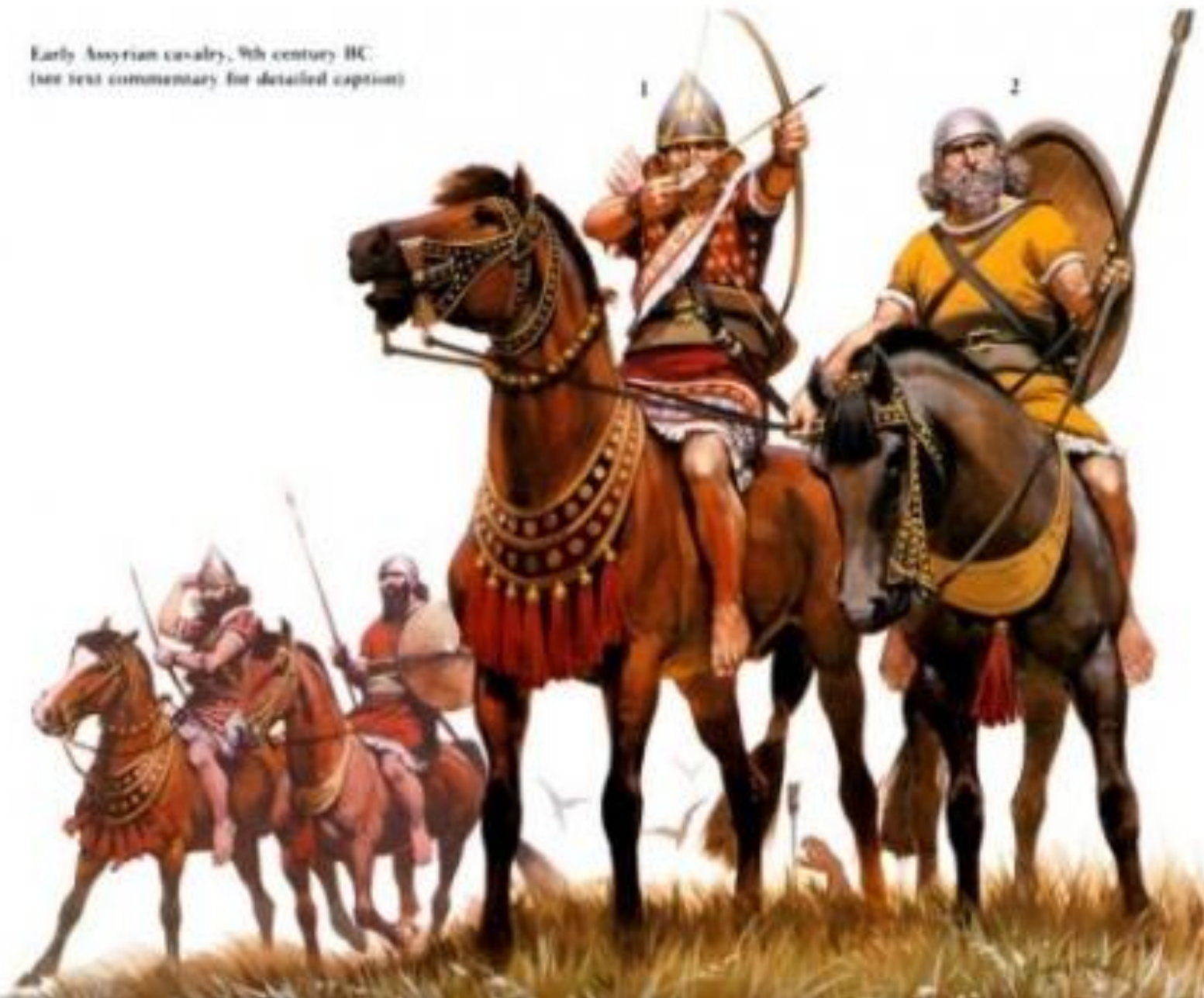
Early Assyrian cavalry, 9th century BC. (see text commentary for detailed caption)