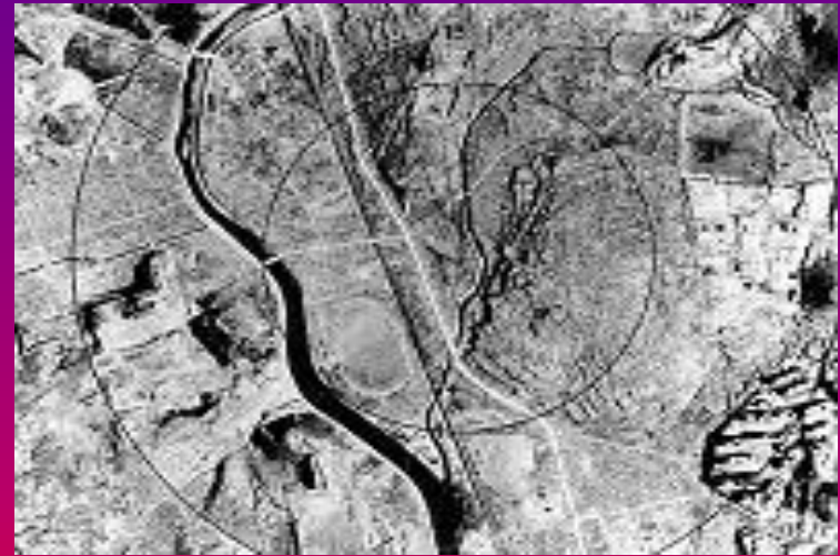
Нагасаки через три дня после взрыва