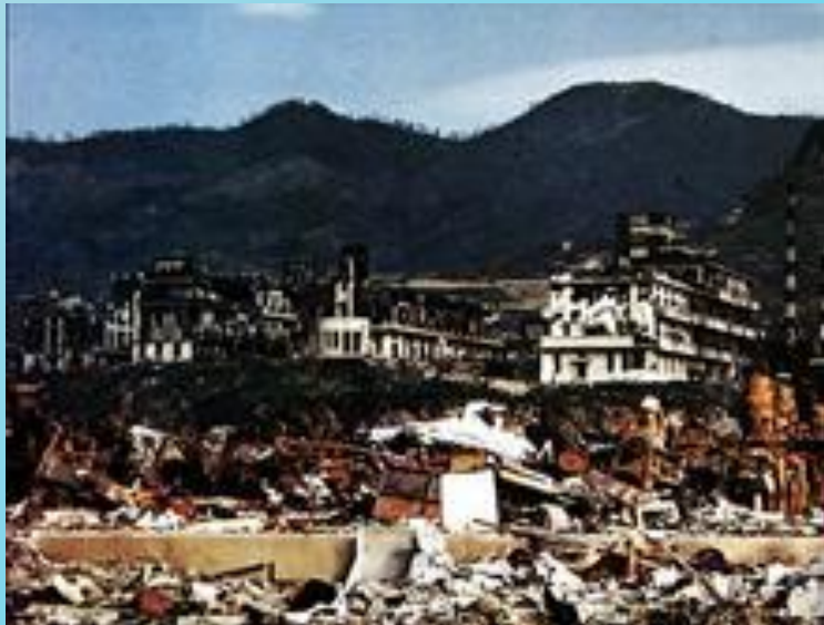
Госпиталь Медицинского колледжа Нагасаки