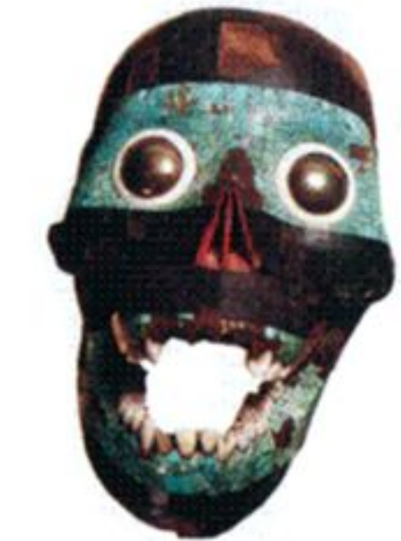
Человеческий череп, покрытый мозаикой из бирюзы и обсидиана.