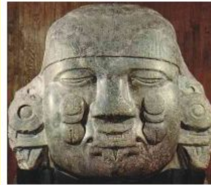
Ацтекская богиня Луны - Койольшауки.