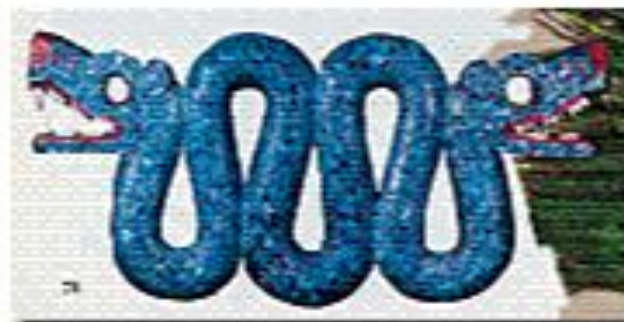
Двуглавая ацтекская змея, выложенная мозаикой из бирюзы.