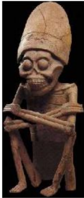
Глиняная фигурка Миктлантекутли - богини смерти.