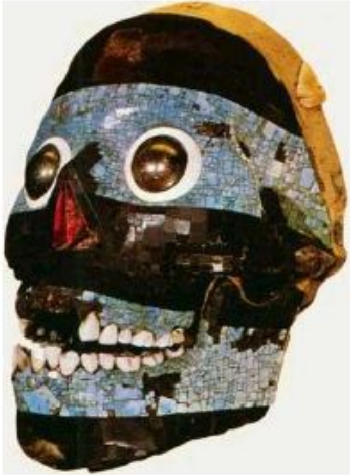
Изображение Тецкатлипоки. Человеческий череп, инкрустированный бирюзой, нефритом, обсидианом и перламутром.