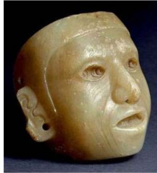
Гипсовая маска из Теночтитлана.