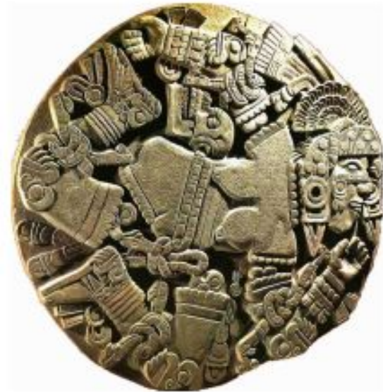
Ацтекская богиня Луны. Диаметр - 3,25 м., толщина-35 см. Камень. Изображение расчленённой богини на каменном блоке, найденном в святилище Уицилопочтли в Теночтитлане.