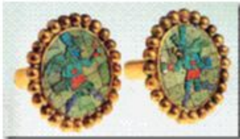
Серьги с мозаикой