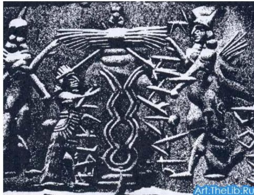
Рельефная роспись боевого барабана ацтеков.