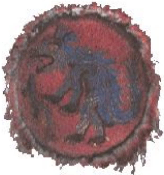
Ацтекский щит с изображением койота