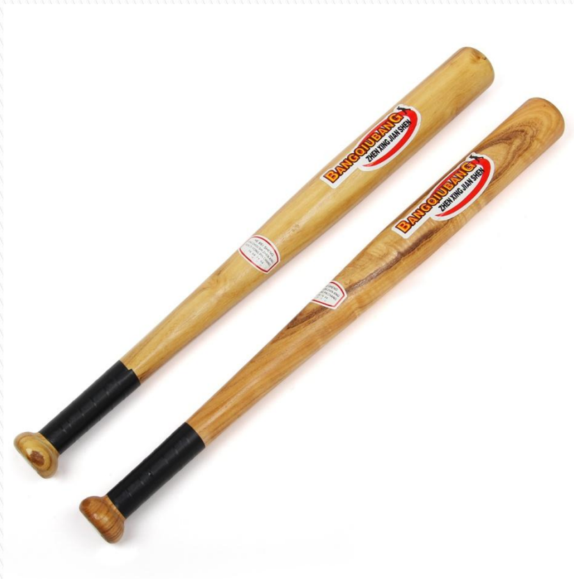
2 вариант : Пацанская бита