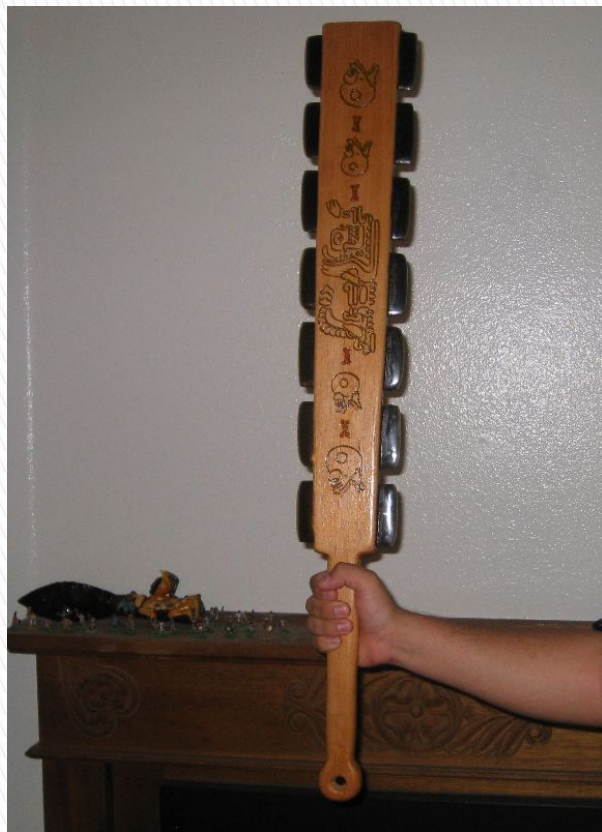
1 вариант : МАКУАУИТЛЬ

А теперь проверка: что из этих предметов было на вооружении у ацтеков?