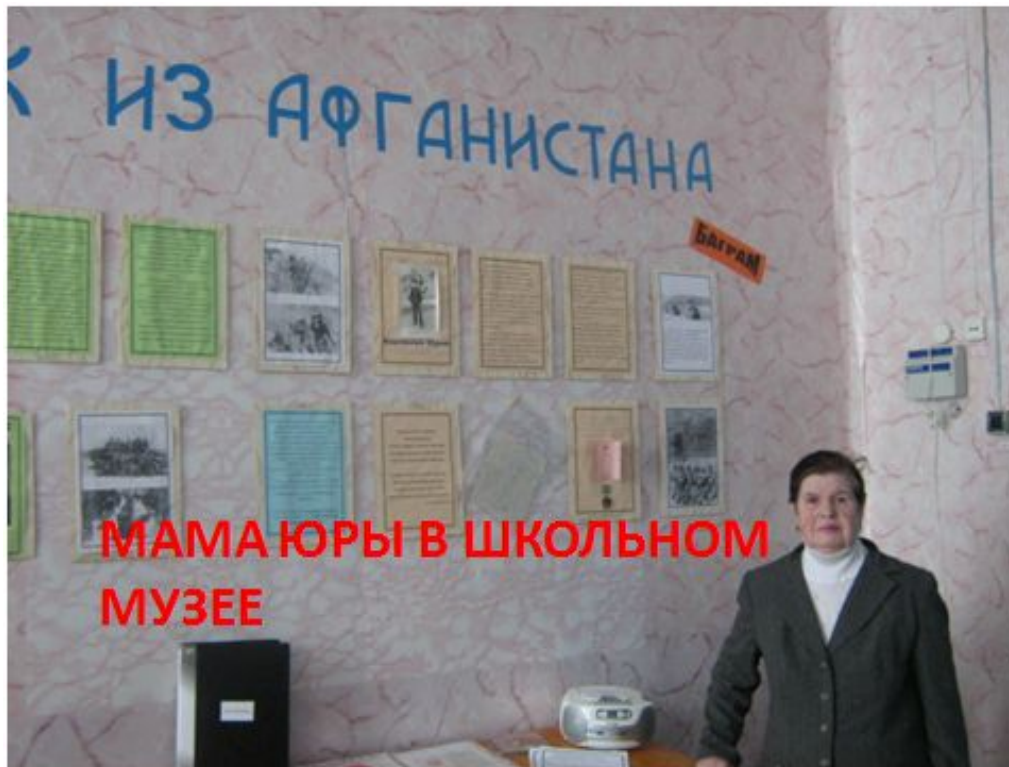
МАМА ЮРЫ В ШКОЛЬНОМ МУЗЕЕ