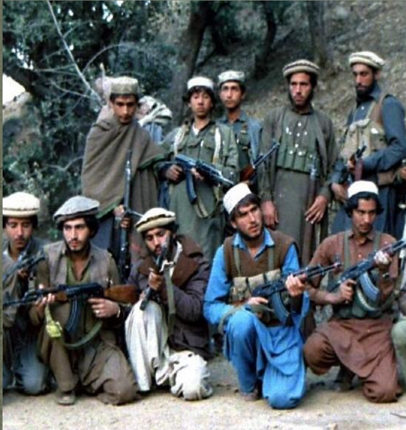
Ауғанстан Ислам партиясының моджахедтері, 1987 жыл.

Бұл “қырғи қабақ соғыс” кезеңі өткеннен кейінгі уақытта да КСРО-ның өзге елдерді өз ықпалына қарату саясатының айқын көрінісі еді. 1965 ж. қаңтарда Ауғанстанда Кеңес Одағы Мемлекеттік қауіпсіздік комитеті (МХК) тыңшыларының қатысуымен жартылай астыртын қызмет атқарған халықтық-демокр. партия (ХДП) құрылып, біраздан соң ол екіге бөлінген.