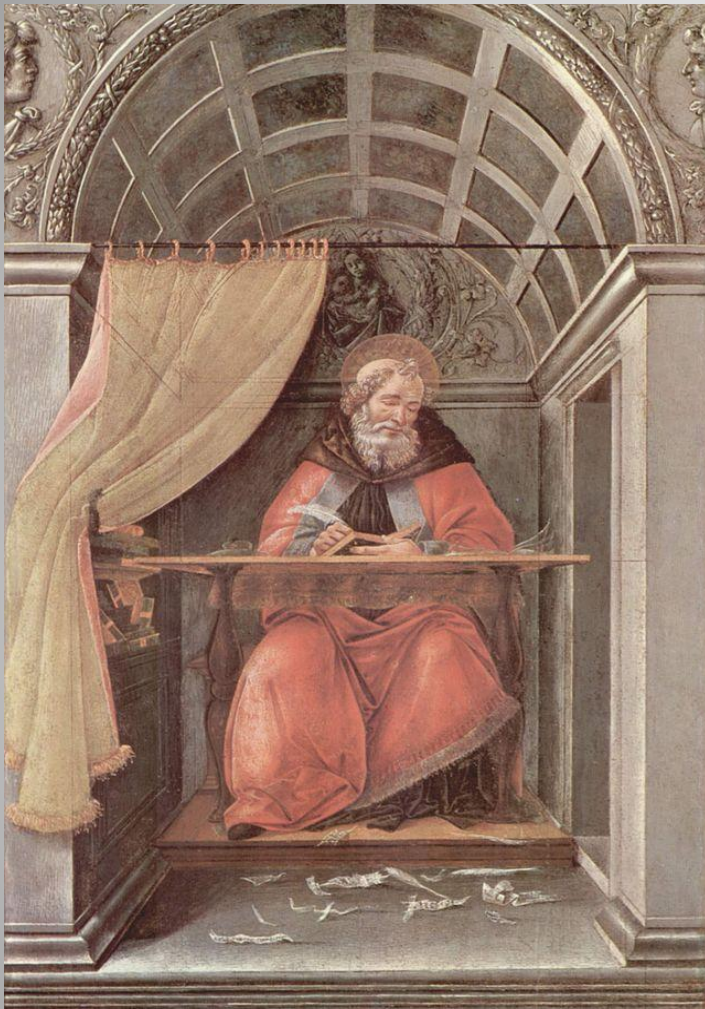
Боттичелли. «Св. Августин»

Августин Блаженный - родоначальник христианской философии истории (раздел философии, призванный ответить на вопросы об объективных закономерностях и духовно-нравственном смысле исторического процесса).