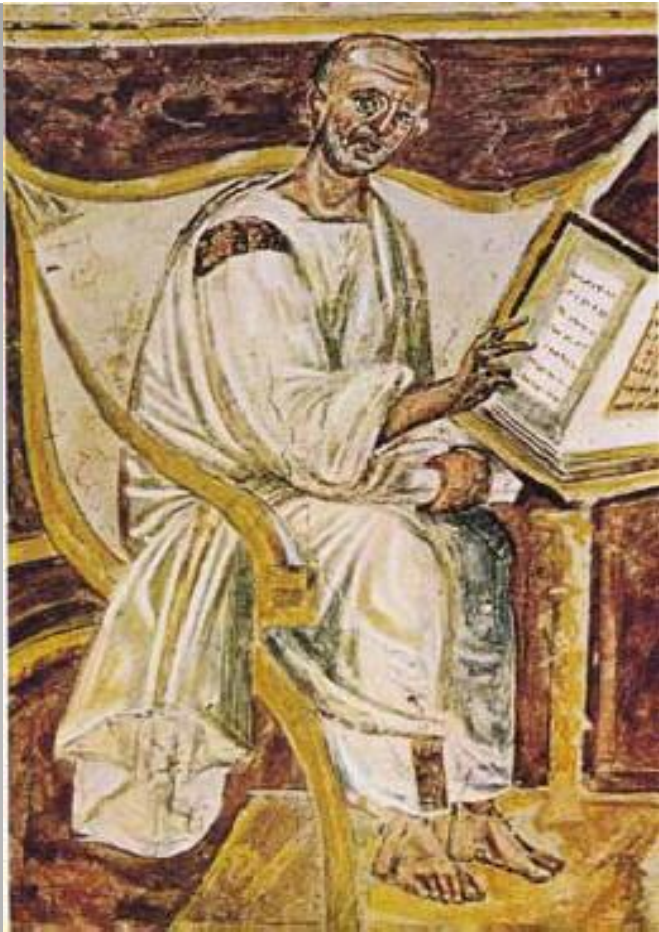
Св. Августин. Фреска капеллы Санта-Санкторум в Латерано. VI в.

Римско-христианский философ, богослов, мудрец. Выходец из Нумидии (в древности область в Северной Африке (современная северная часть Туниса и Алжира)). Являлся одной из ключевых фигур в истории европейской философии. Происходил из небогатой провинциальной семьи и в молодости испытал влияние своей матери-христианки.