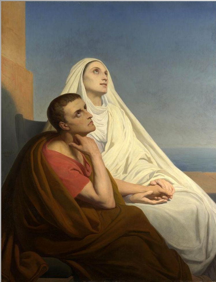
Святой Августин и Святая Моника