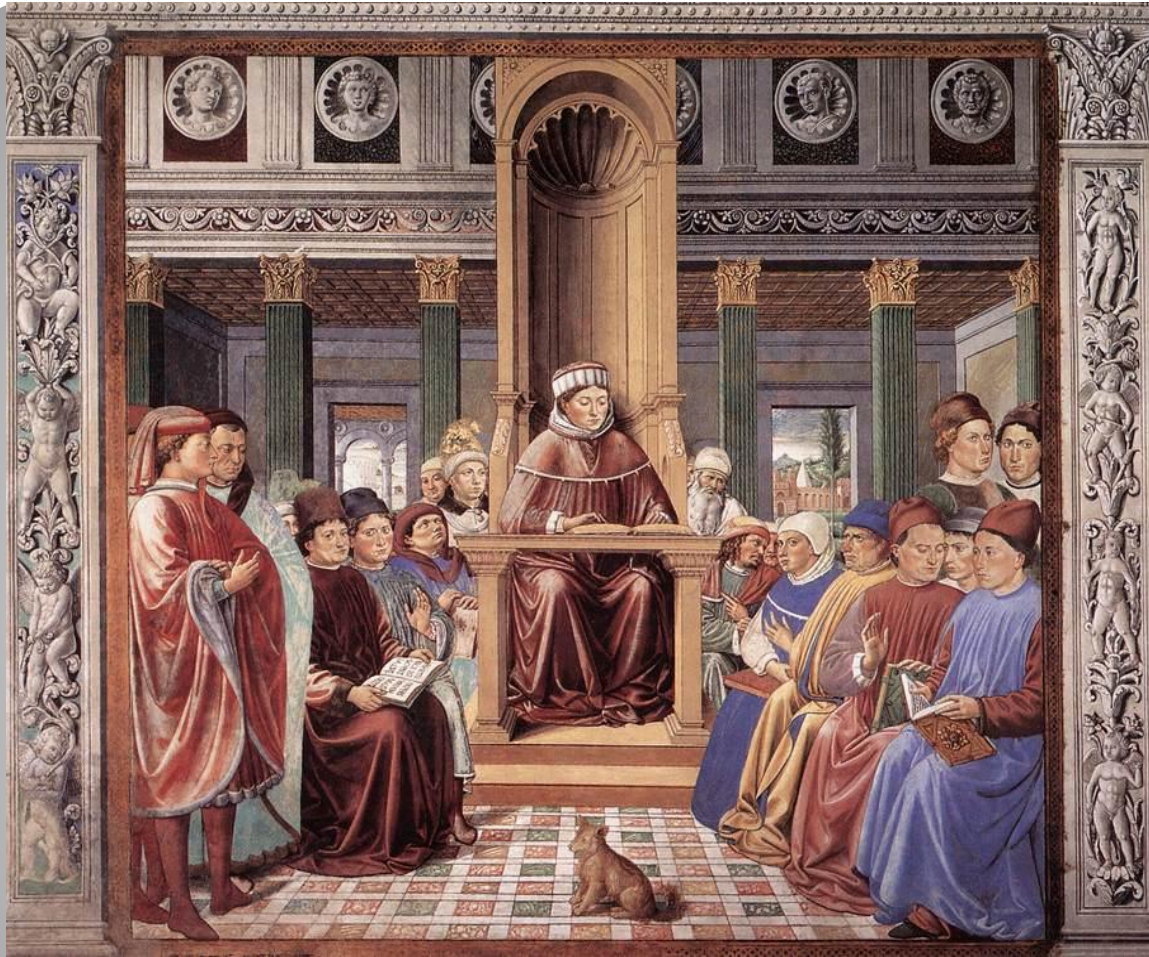
Бенотцо Гоццолли. Св. Августин учит в Риме. 1464—1465 гг.

Его наследие по теологии и критике поистине огромно. Наиболее известен автобиографический труд «Исповедь», положивший начало исповедальному жанру. Августин назван католическими богословами «блаженным». Как богослов и писатель имел сильное влияние на оформление всей догматики католицизма. Наиболее известные произведения: «О христианской доктрине», «О граде Божием». Учение Августина стало неопровержимым авторитетом в эпоху средневековья.