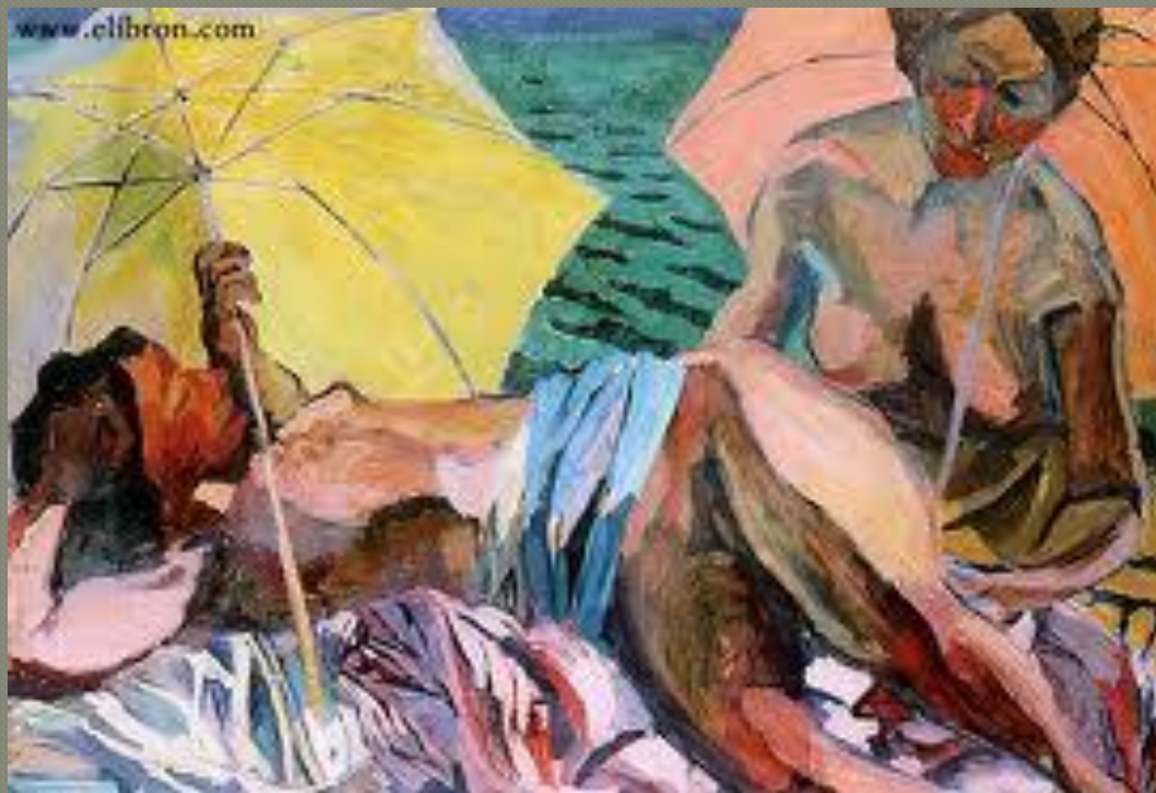
«Женщины с зонтами (купальщицы)»

Художественные достижения Лентулова середины 1910-х получили признание среди широких кругов художественной общественности. Его поиски в области цвета совпали с аналогичными процессами в области театральной декорации, и в 1915—1916 годах художник оформил спектакль «Виндзорские проказницы» В. Шекспира для Камерного театра А. Таирова. Театр, очевидно, подтолкнул Лентулова к созданию панно на тему «купальщиц».