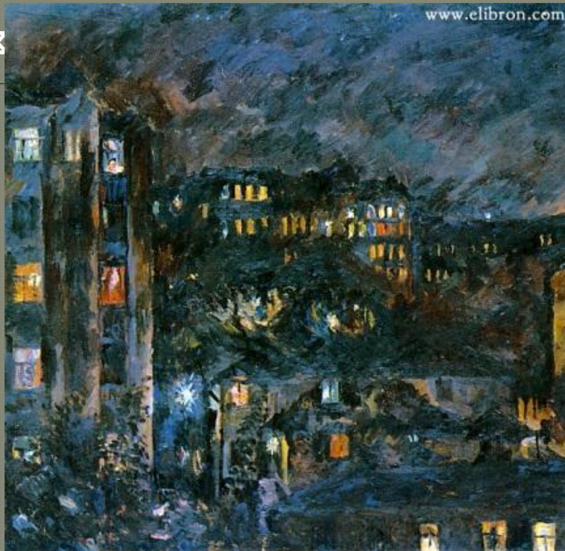
«НОЧЬ НА БРОННОЙ», 1927

К концу 1920-х лирические тенденции окончательно победили, художник создал поэтичные виды ночного города.