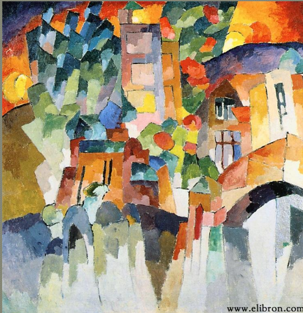
«КИСЛОВОДСКИЙ ПЕЙЗАЖ СО СТВОРКАМИ ДВЕРЕЙ (ПЕЙЗАЖ С ВОРОТАМИ)»