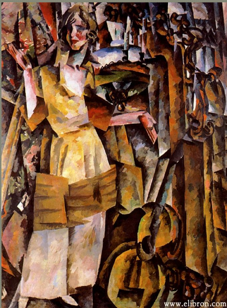
«Портрет актрисы Александры Сергеевны Хохловой»

В том же году был создан кубофутуристический портрет киноактрисы А.С. Хохловой. Она снималась в немом кино и постановочной фотографии. Движение и поза были единственными средствами выражения в арсенале ее мастерства, и эта особенность искусства актрисы получила блестящее отражение в портрете кисти Лентулова.