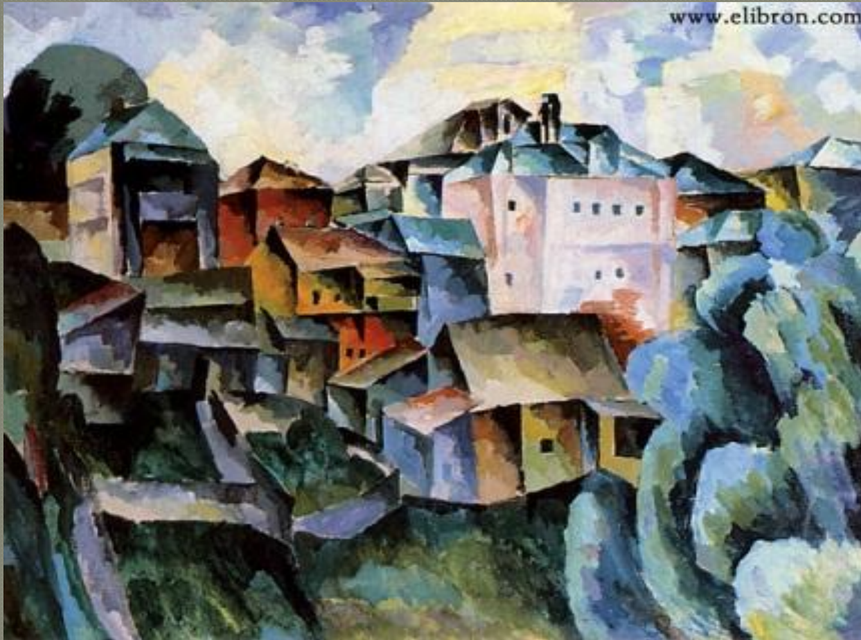
«ПЕЙЗАЖ С РОЗОВЫМ ДОМОМ», 1920

В период с конца 1910-х до начала 1920-х в искусство Лентулова постепенно начали проникать реалистические тенденции. В это время художник много внимания уделял пейзажам Лавры, Сергиева Посада и Москвы, фантазировал на тему цвета