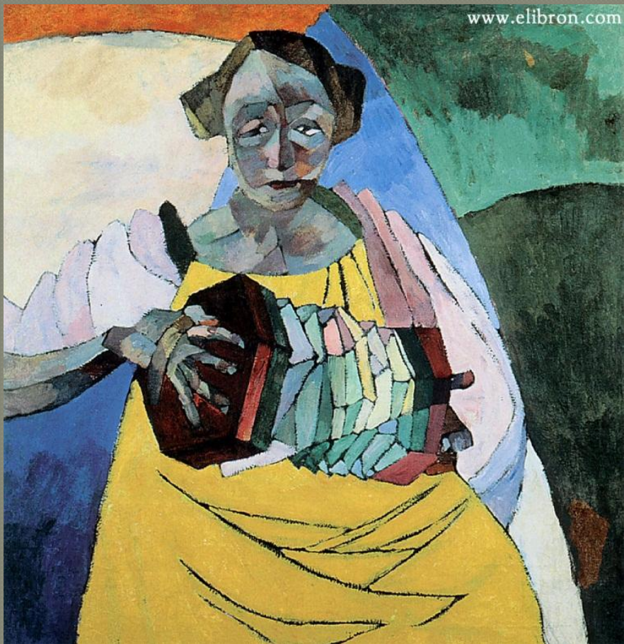
«Женщина с гармоникой»