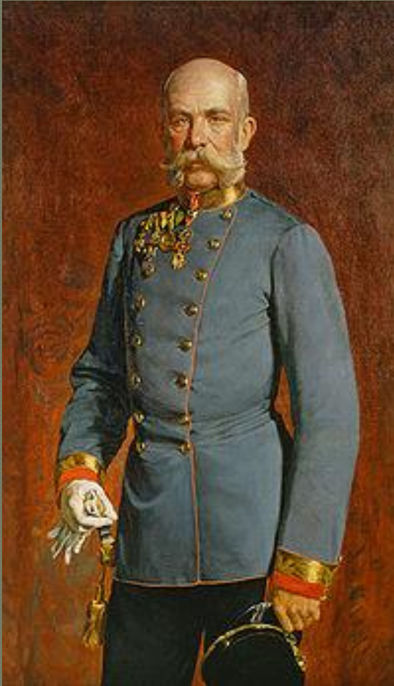
Император Франц Иосиф I (1867-1916гг.)

Империя переживала острый политический кризис.