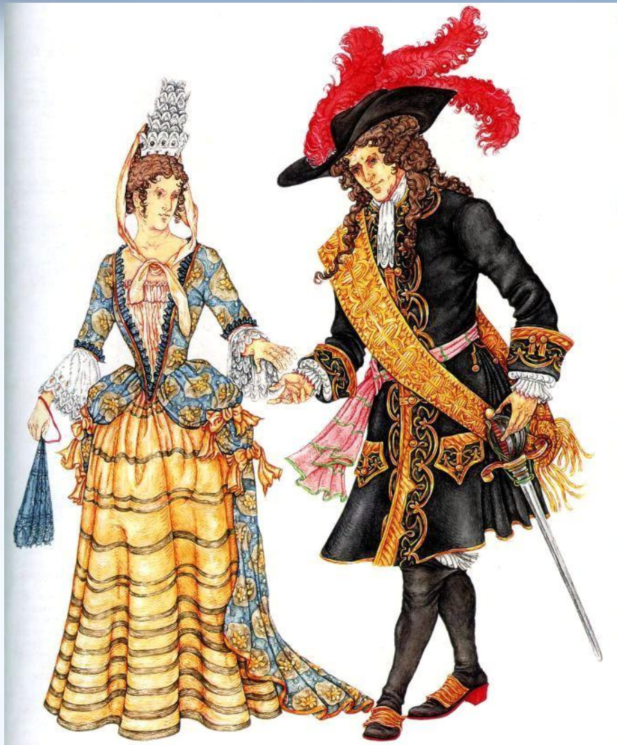
Салтанатты көйлек және сот қызметінің киімі