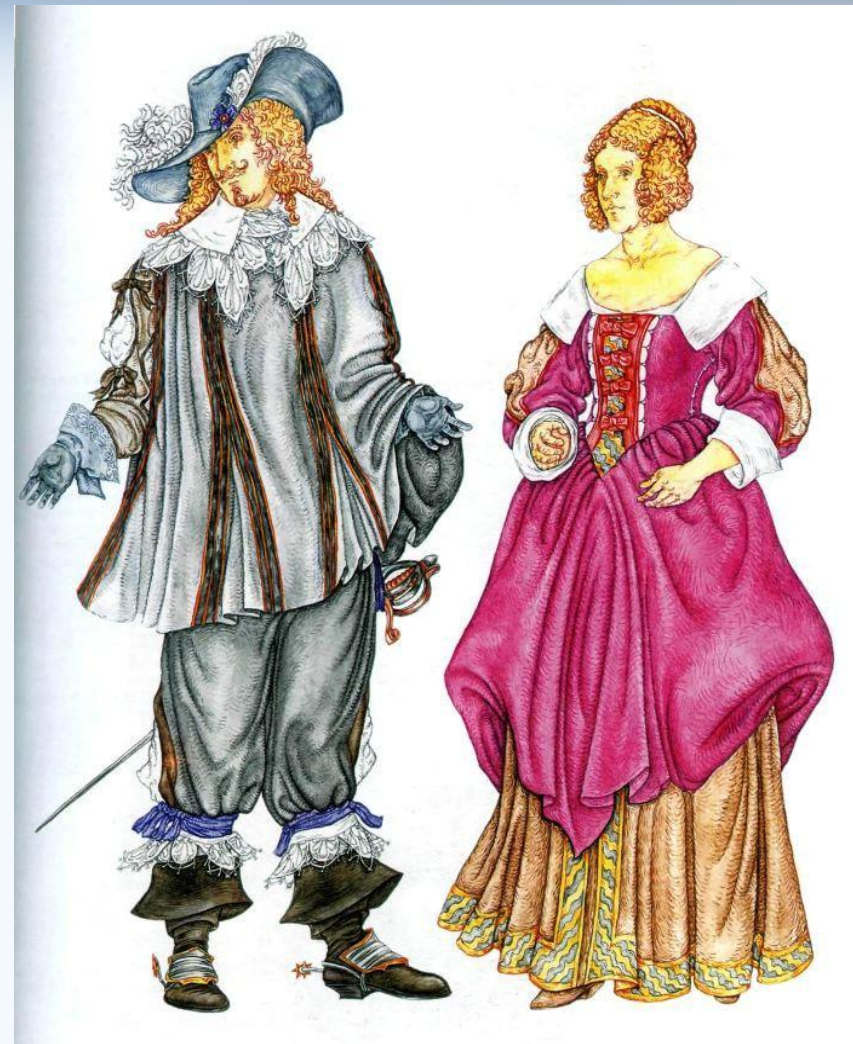
Мушкетер киімі ,шляпа а-ля-Рубенс, ботфорт-аяқ киімі және қала тұрғыны киімі.