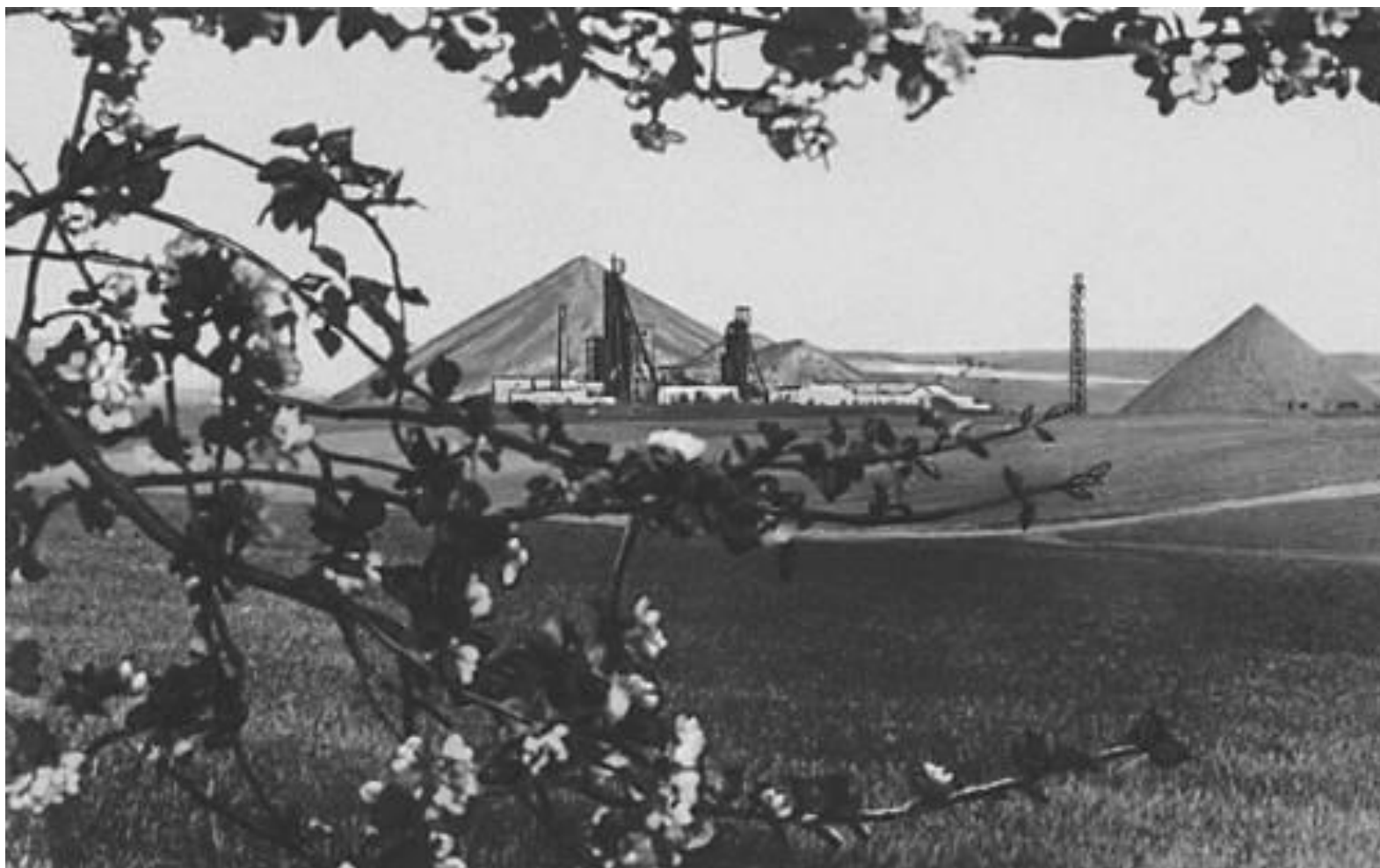
Қарағанды шахталарының бірі