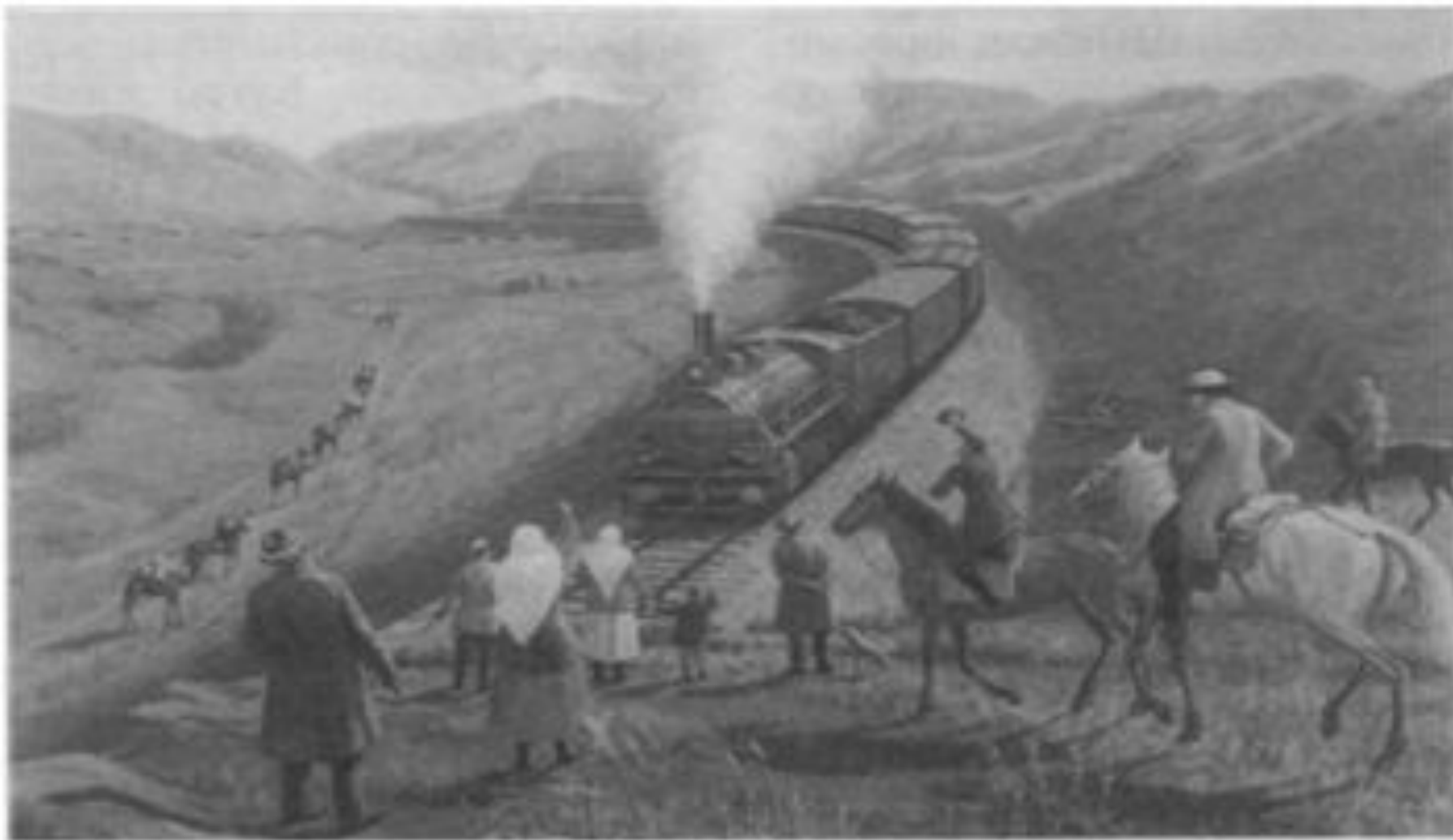
Түркістан-Сібір темір жолы (Ә.Қастеев)