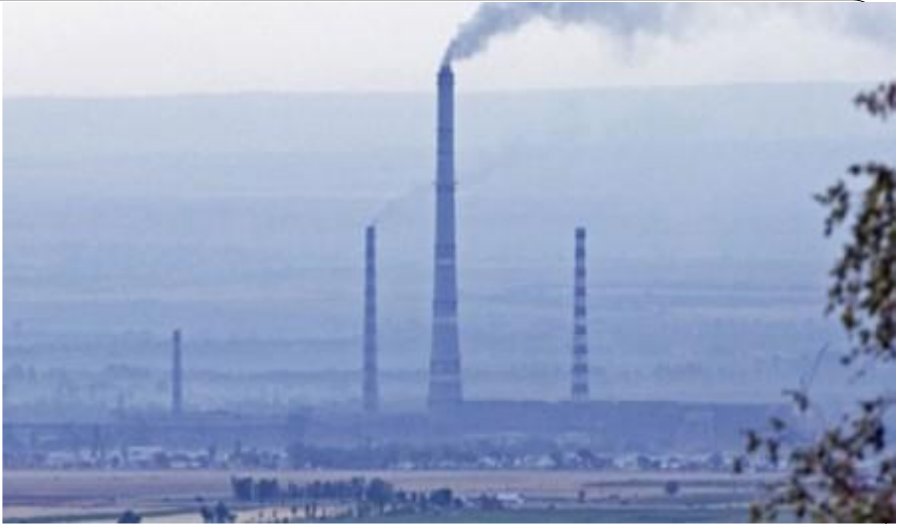
Шымкент қорғасын зауыты