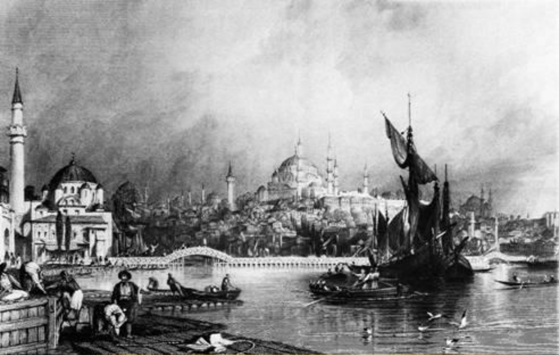
Стамбул в 19 веке