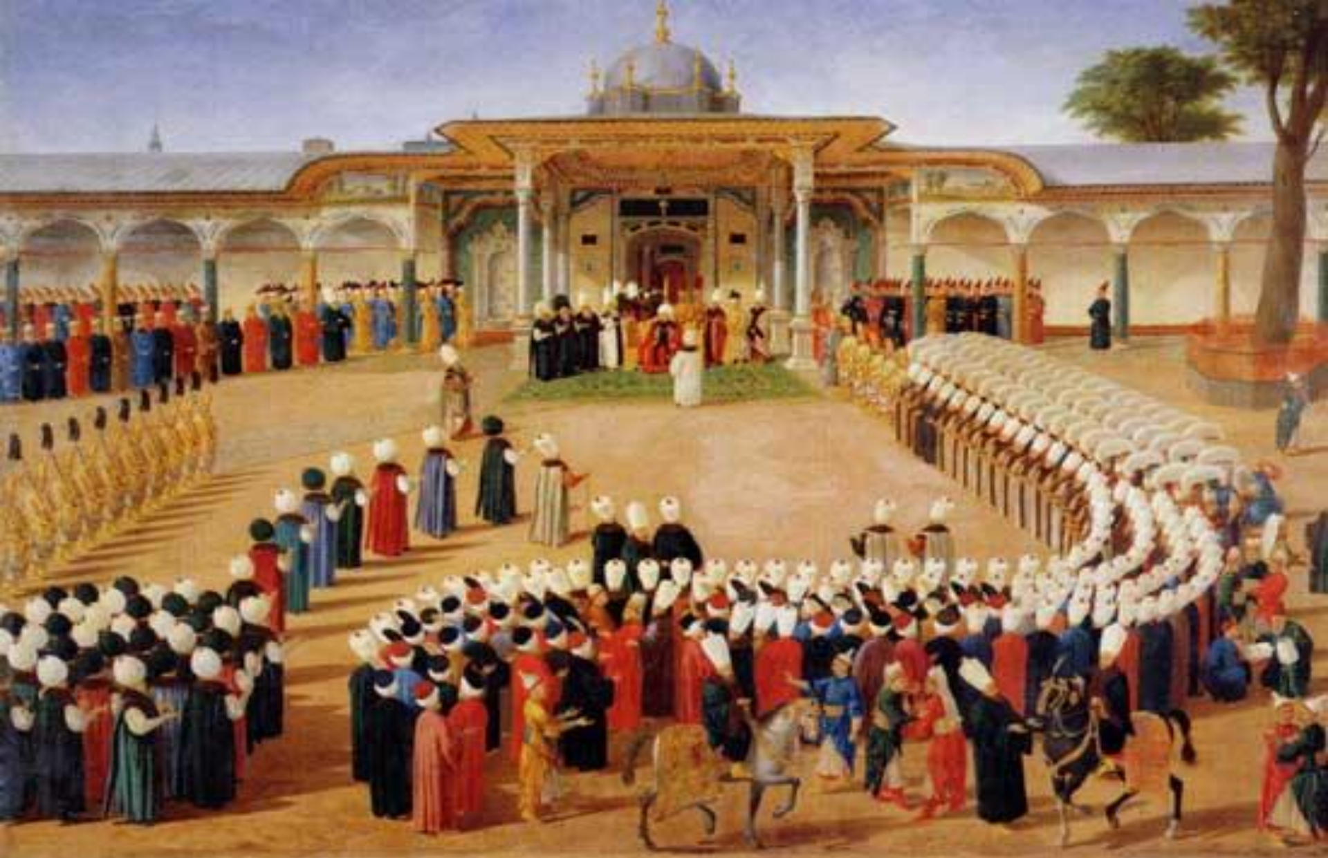
Принятие Конституции Турции в 1877 г султаном Абдул-Хамидом II.