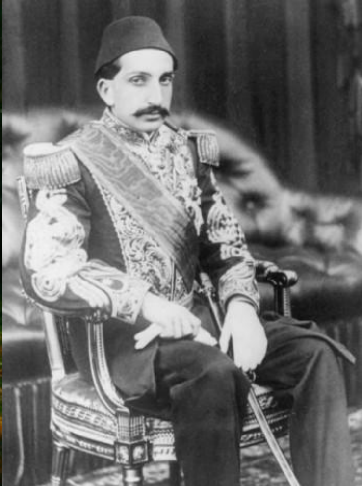
Султан Абдул-Хамид II последний султан.

В апреле 1877 г. Россия начала войну. Турки были разбиты и 3 марта 1877 г. заключили мир на Балканах возникла независимая Болгария. На Берлинском конгрессе летом 1878 г. Турция возвратила ряд утерянных в ходе войны земель.