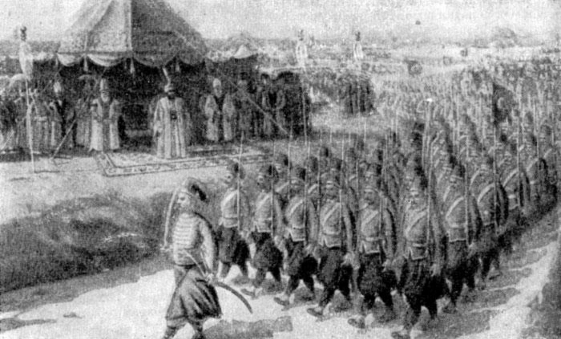
Парад турецких войск принимает султан СЕЛИМ III