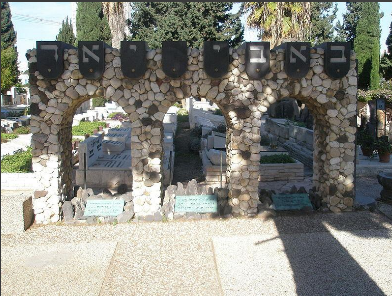
Памятник в Нахалат Ицхак в Израиле (Большая надпись сверху «Бабий Яр»)