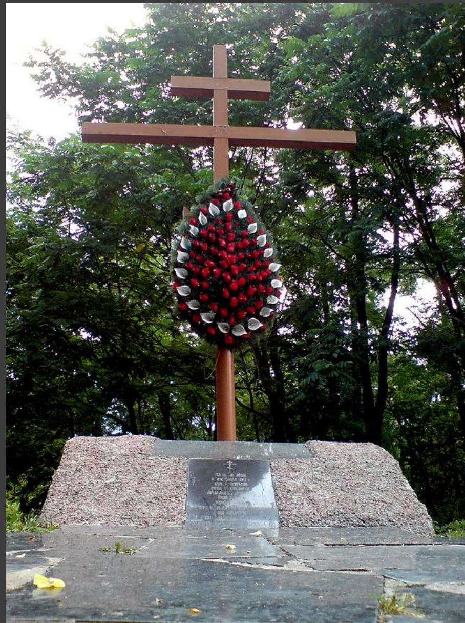
Крест на месте расстрела православных священников в ноябре 1941 г.