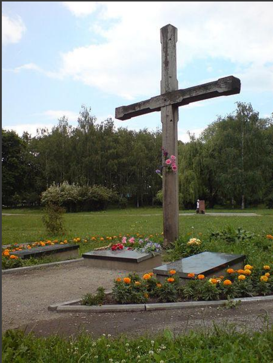
Крест в память о расстрелянных в Бабьем Яру украинских националистах