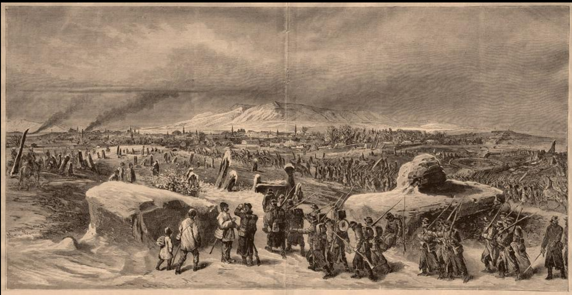
Корпус генерала И.В.Гурко занимает Софию в районе древнеримских развалин. 23 декабря 1877 г. (4 января 1878 г.)