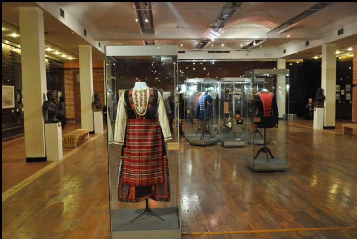
Национальный костюм болгарки. Экспозиция выставки