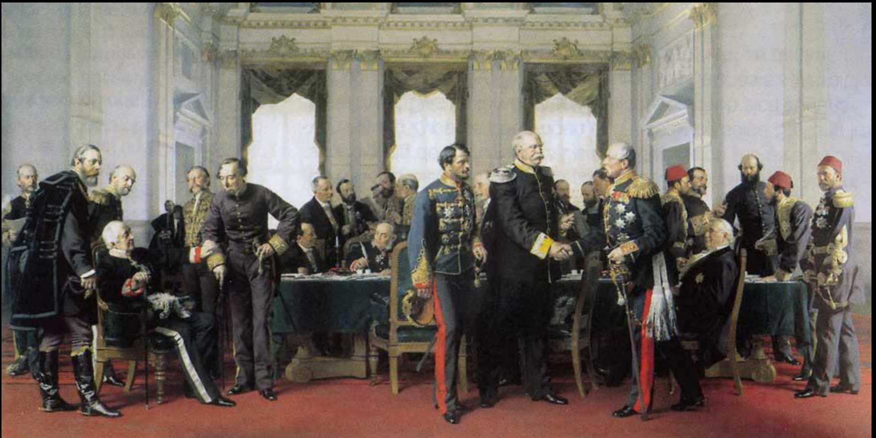
А. фон Вернер. Берлинский конгресс 1878 г. 1881

На Берлинском конгрессе летом 1878 г. был подписан Берлинский трактат, зафиксировавший возврат России южной части Бессарабии и присоединение Карса, Ардагана и Батума. Была восстановлена государственность Болгарии (завоеванная Османской империей в 1396 г.); увеличивались территории Сербии, Черногории и Румынии.