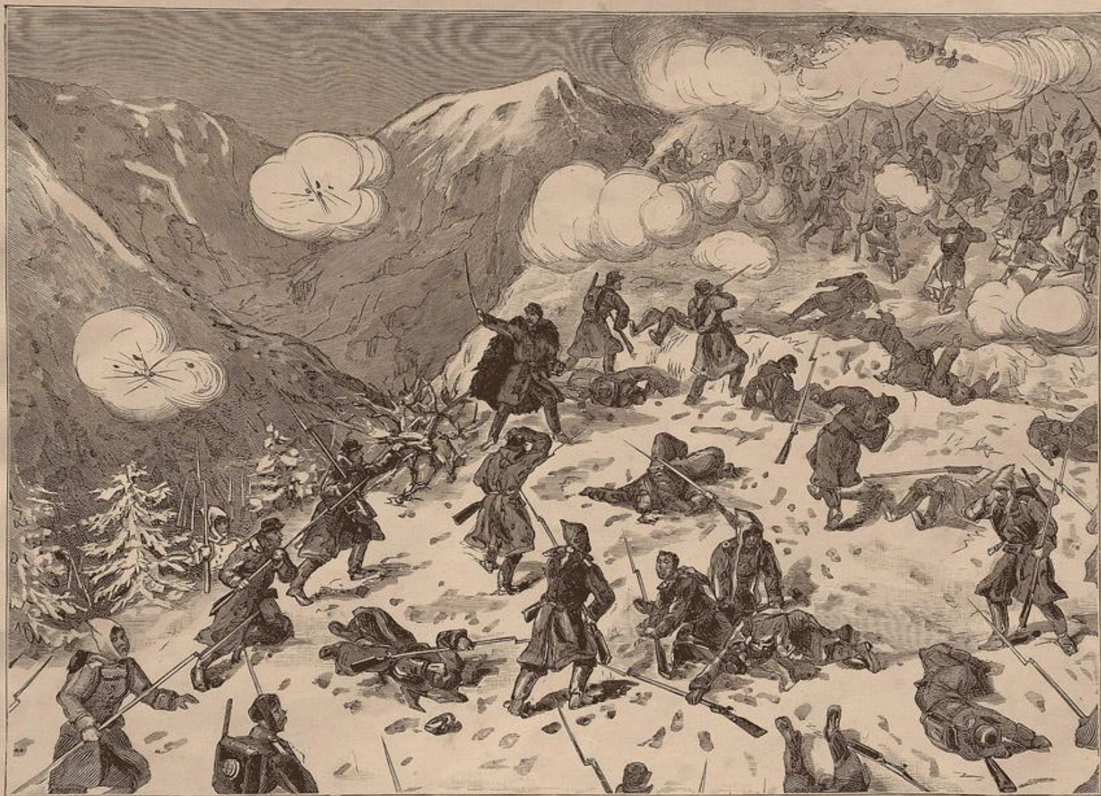
4-я стрѣлковая бригада идетъ на штурмъ Шипкинскихъ позицій 26 / 27 Декабря 1877 года.

Дозволено Цензурою. С.-Петербургъ, 30 Января 1879 г.