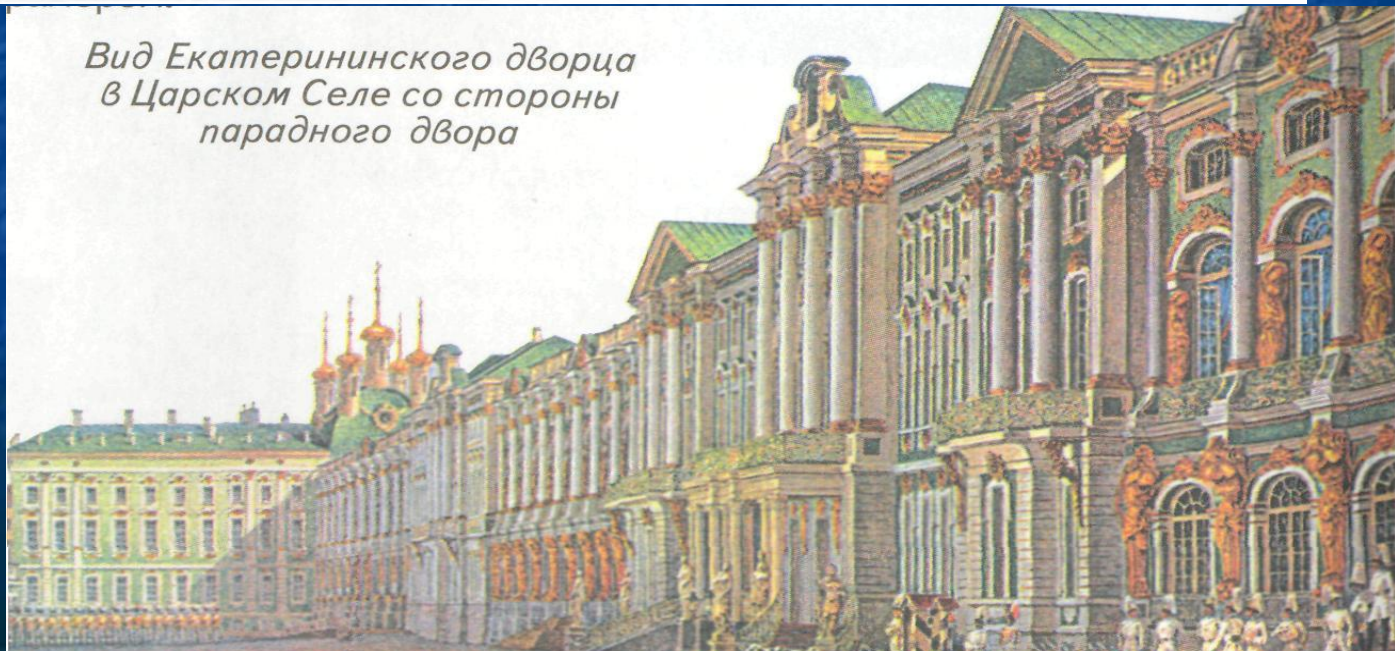
Вид Екатерининского дворца в Царском Селе со стороны парадного двора