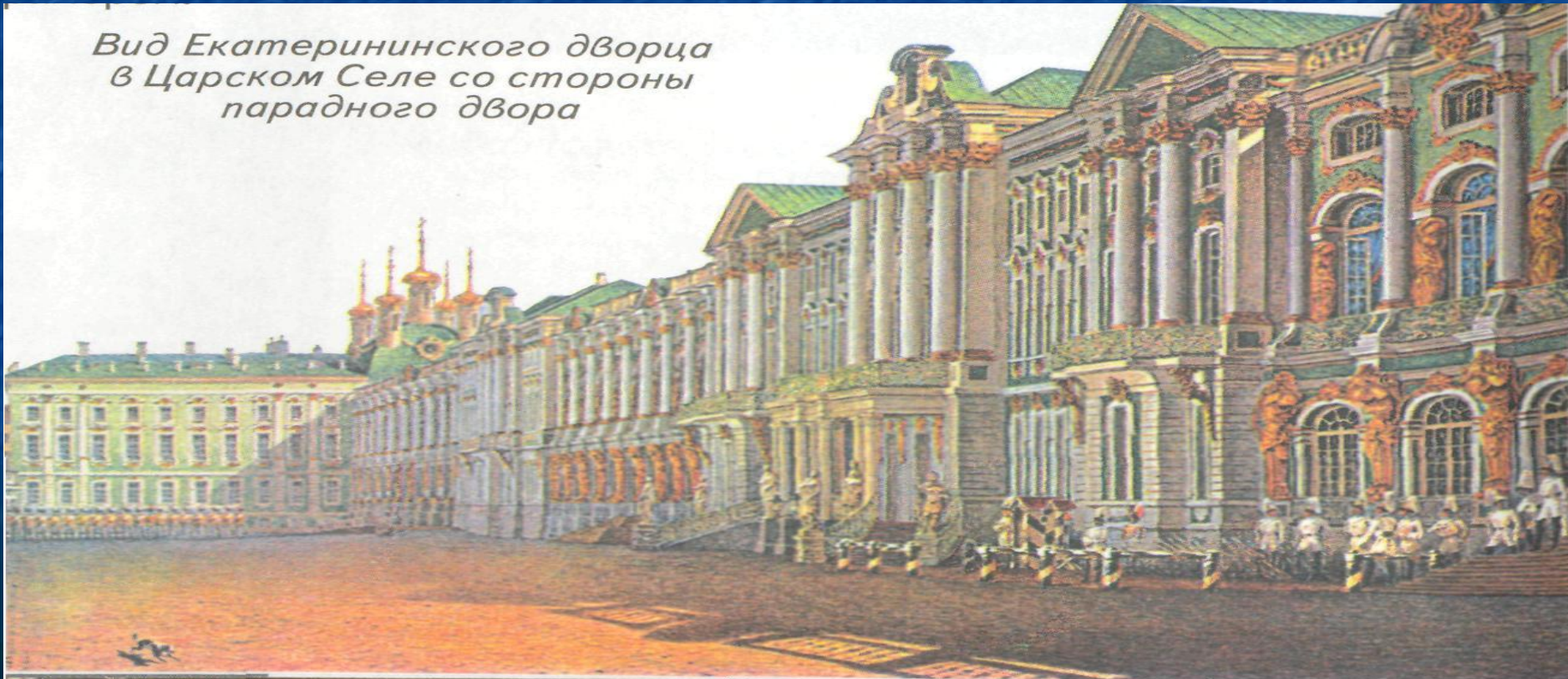
Вид Екатерининского дворца в Царском Селе со стороны парадного двора