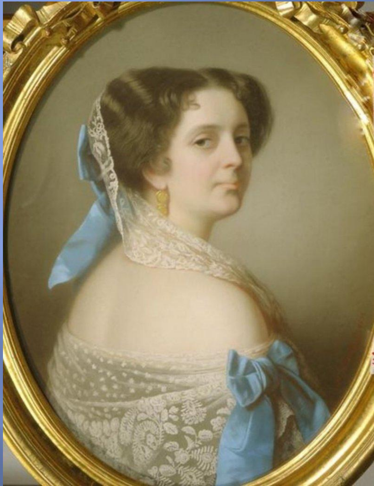
БАРОНЕССА ЕВА АВРОРА ШАРЛОТТА ШЕРНВАЛЬ (1808 – 1902)