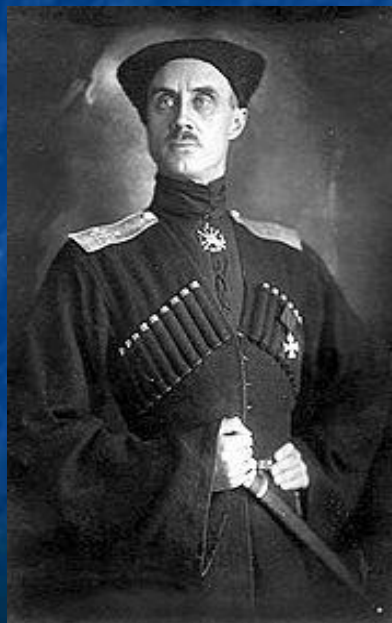
Барон П. Н. Врангель