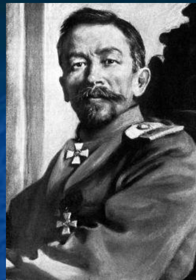
Генерал Л. Г. Корнилов