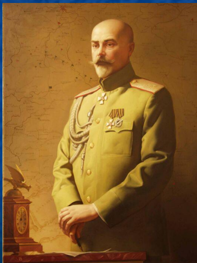
Генерал А. И. Деникин