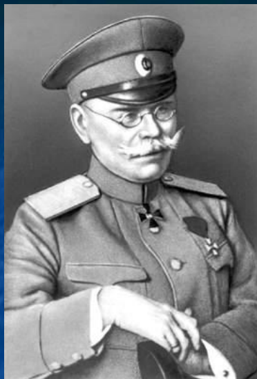
Генерал М. В. Алексеев