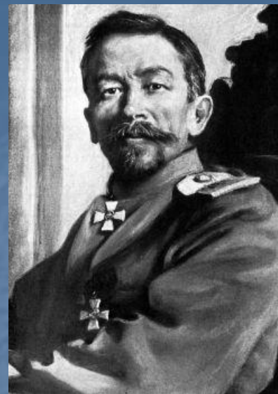
Генерал Л. Г. Корнилов