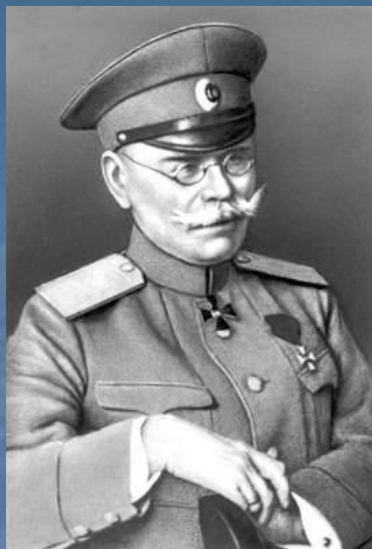
Генерал М. В. Алексеев