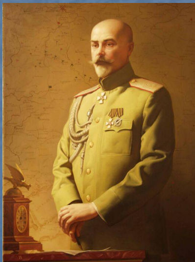
Генерал А. И. Деникин