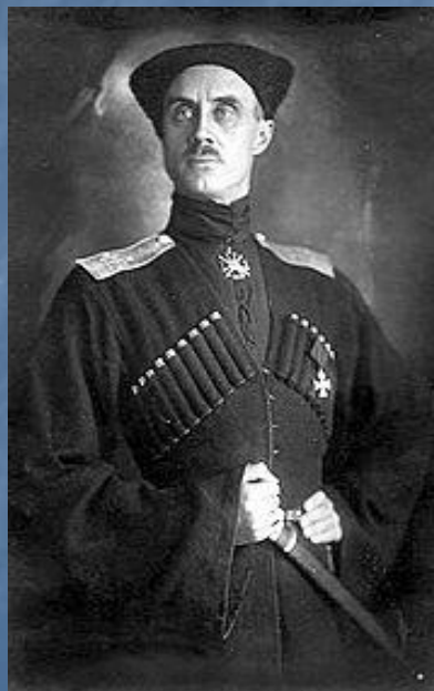
Барон П. Н. Врангель