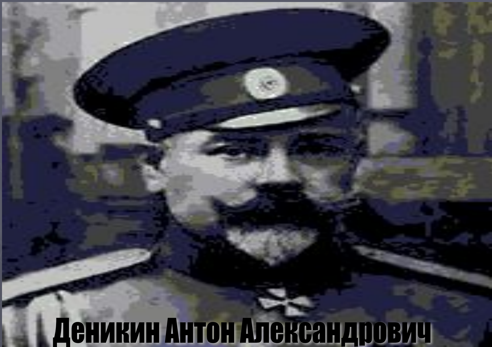
Деникин Антон Александрович