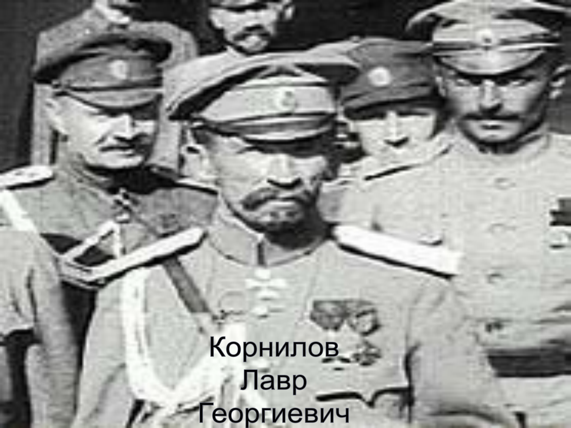
Корнилов Лавр Георгиевич