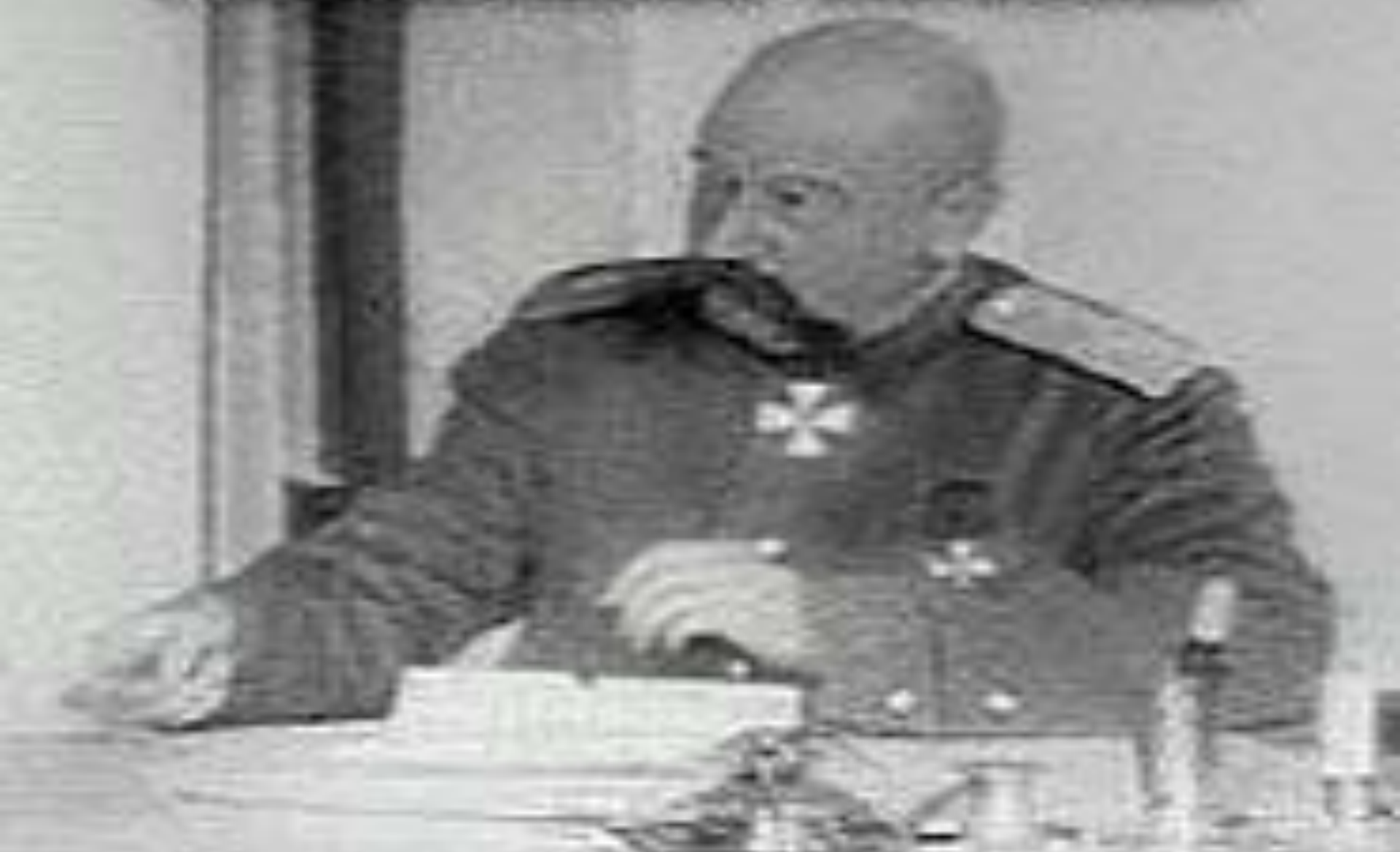
Юденич Николай Николаевич