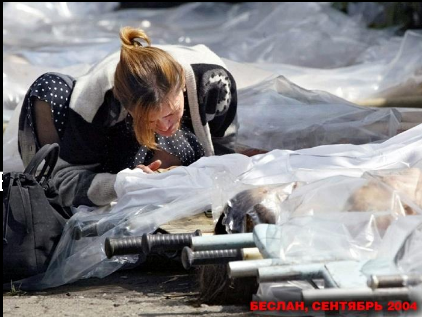
БЕСЛАН, СЕНТЯБРЬ 2004