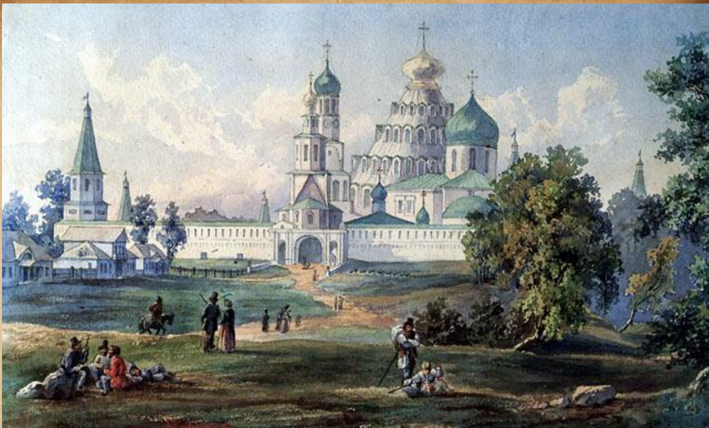
Воскресенский монастырь под Москвой, именуемый «Новым Иерусалимом»,