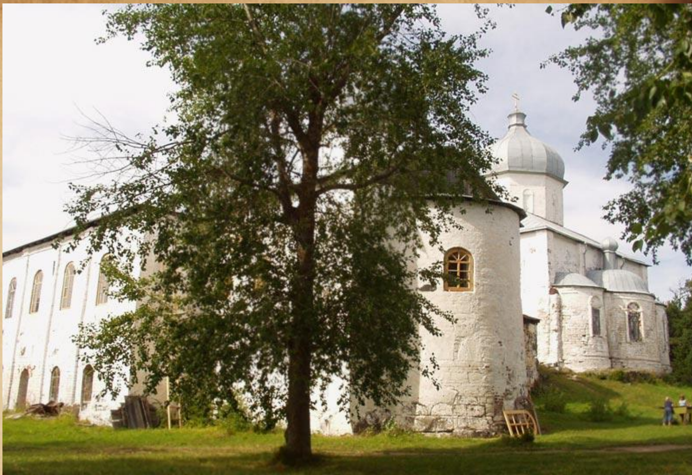
Крестный Кийостровский монастырь в Онежской губе.