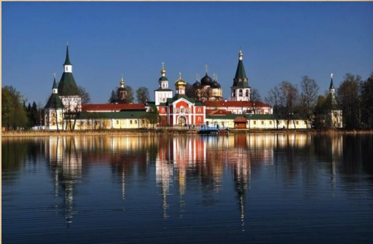
Иверский Святоозерский монастырь на Валдае

Первосвятитель всячески поощрял церковное строительство, сам он был одним из лучших зодчих своего времени. При Патриархе Никоне были сооружены богатейшие монастыри Православной Руси: