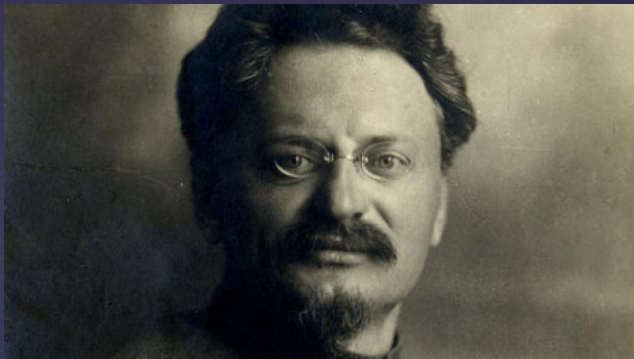
Лев Давидович Троцкий Лейб Давидович Бронштейн (1879-1940)