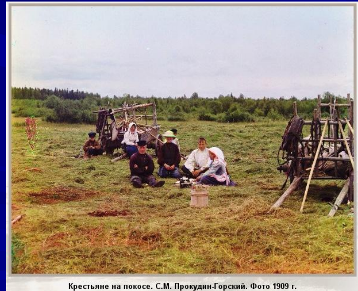
Крестьяне на покосе. С.М. Прокудин-Горский. Фото 1909 г.