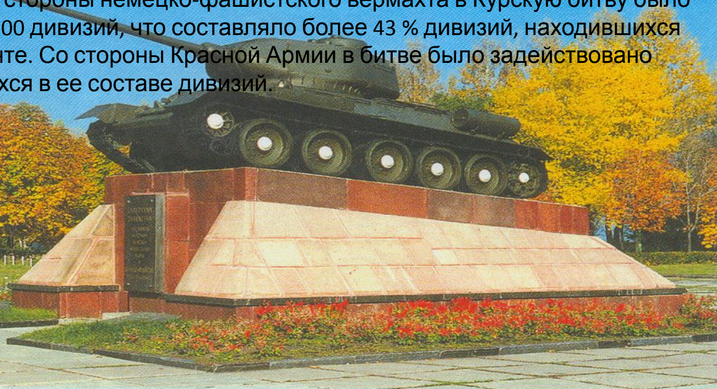
Памятник советским танкистам — участникам разгрома немецко-фашистских войск в Курской битве

Размах, напряженность борьбы и достигнутые результаты ставят битву под Курском в ряд крупнейших битв не только Великой Отечественной, но и всей Второй мировой войны. В течение 50 суток на сравнительно небольшой территории вели ожесточенную борьбу 2 мощнейшие группировки вооруженных сил противоборствующих сторон. В беспрецедентных по напряженности, ожесточению и упорству сражениях с обеих сторон участвовали более 4 млн человек, свыше 69 тыс. орудий и минометов, более 13 тыс. танков и самоходных (штурмовых) орудий, до 12 тыс. самолетов. Со стороны немецко-фашистского вермахта в Курскую битву было вовлечено свыше 100 дивизий, что составляло более 43 % дивизий, находившихся на Восточном фронте. Со стороны Красной Армии в битве было задействовано около 30 % имевшихся в ее составе дивизий.