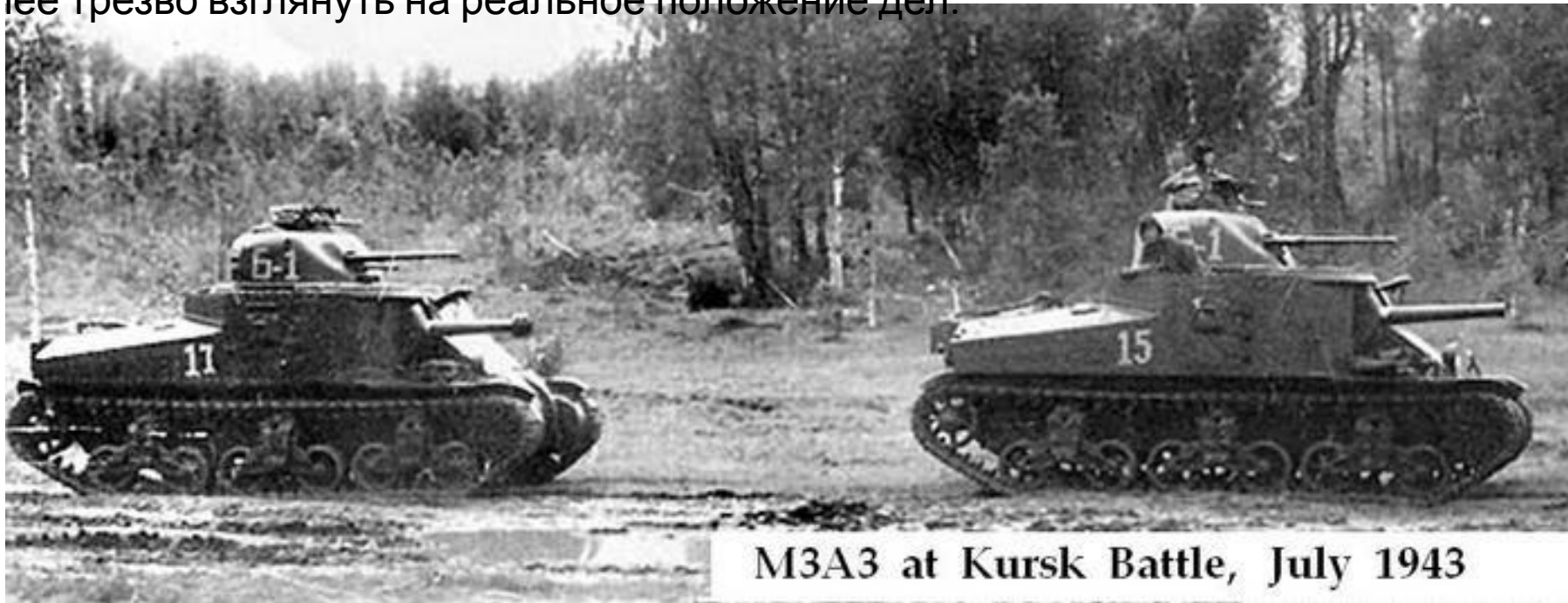
M3A3 at Kursk Battle, July 1943

Беспримерное по ожесточенности и напряженности борьбы сражение под Курском завершилось победой Красной Армии. Бронированные армады врага разбились о неприступность советской обороны. Честолюбивые надежды немецко-фашистского командования на захват стратегической инициативы и изменение хода войны в свою пользу рухнули. Гитлеровским стратегам пришлось отказаться от наступательных планов и спешно принимать решение на переход к стратегической обороне. Так суровая действительность опровергла глубоко ошибочные представления врага о непобедимости германской армии летом и вынудила его более трезво взглянуть на реальное положение дел.