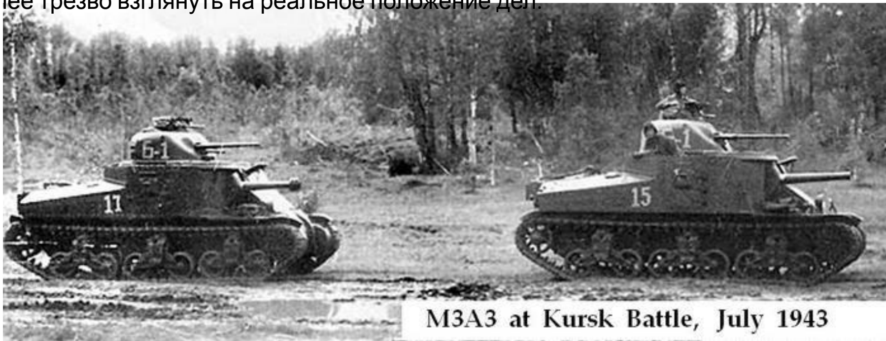
M3A3 at Kursk Battle, July 1943

Беспримерное по ожесточенности и напряженности борьбы сражение под Курском завершилось победой Красной Армии. Бронированные армады врага разбились о неприступность советской обороны. Честолюбивые надежды немецко-фашистского командования на захват стратегической инициативы и изменение хода войны в свою пользу рухнули. Гитлеровским стратегам пришлось отказаться от наступательных планов и спешно принимать решение на переход к стратегической обороне. Так суровая действительность опровергла глубоко ошибочные представления врага о непобедимости германской армии летом и вынудила его более трезво взглянуть на реальное положение дел.