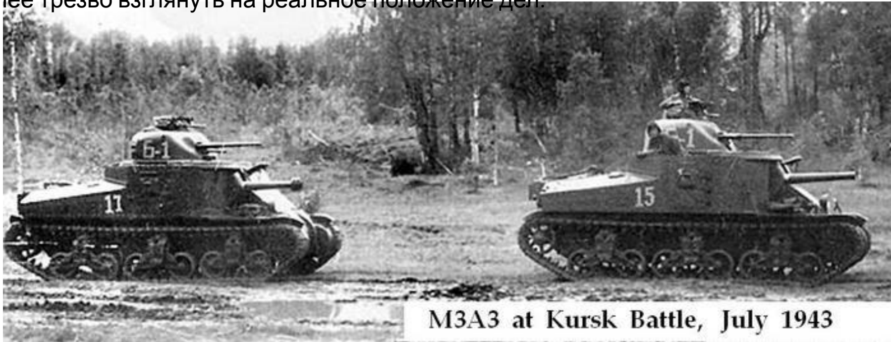
M3A3 at Kursk Battle, July 1943

Беспримерное по ожесточенности и напряженности борьбы сражение под Курском завершилось победой Красной Армии. Бронированные армады врага разбились о неприступность советской обороны. Честолюбивые надежды немецко-фашистского командования на захват стратегической инициативы и изменение хода войны в свою пользу рухнули. Гитлеровским стратегам пришлось отказаться от наступательных планов и спешно принимать решение на переход к стратегической обороне. Так суровая действительность опровергла глубоко ошибочные представления врага о непобедимости германской армии летом и вынудила его более трезво взглянуть на реальное положение дел.