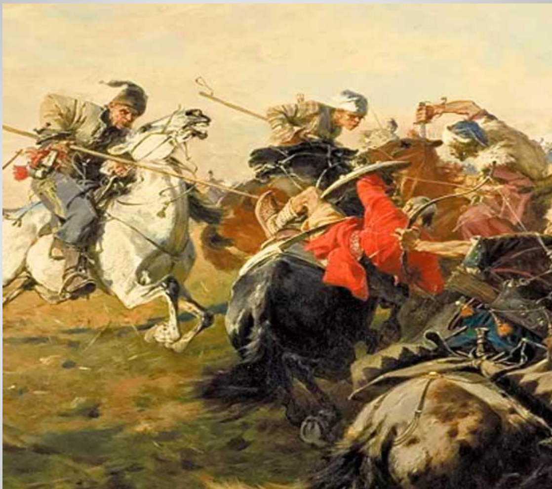
Битва під батогом