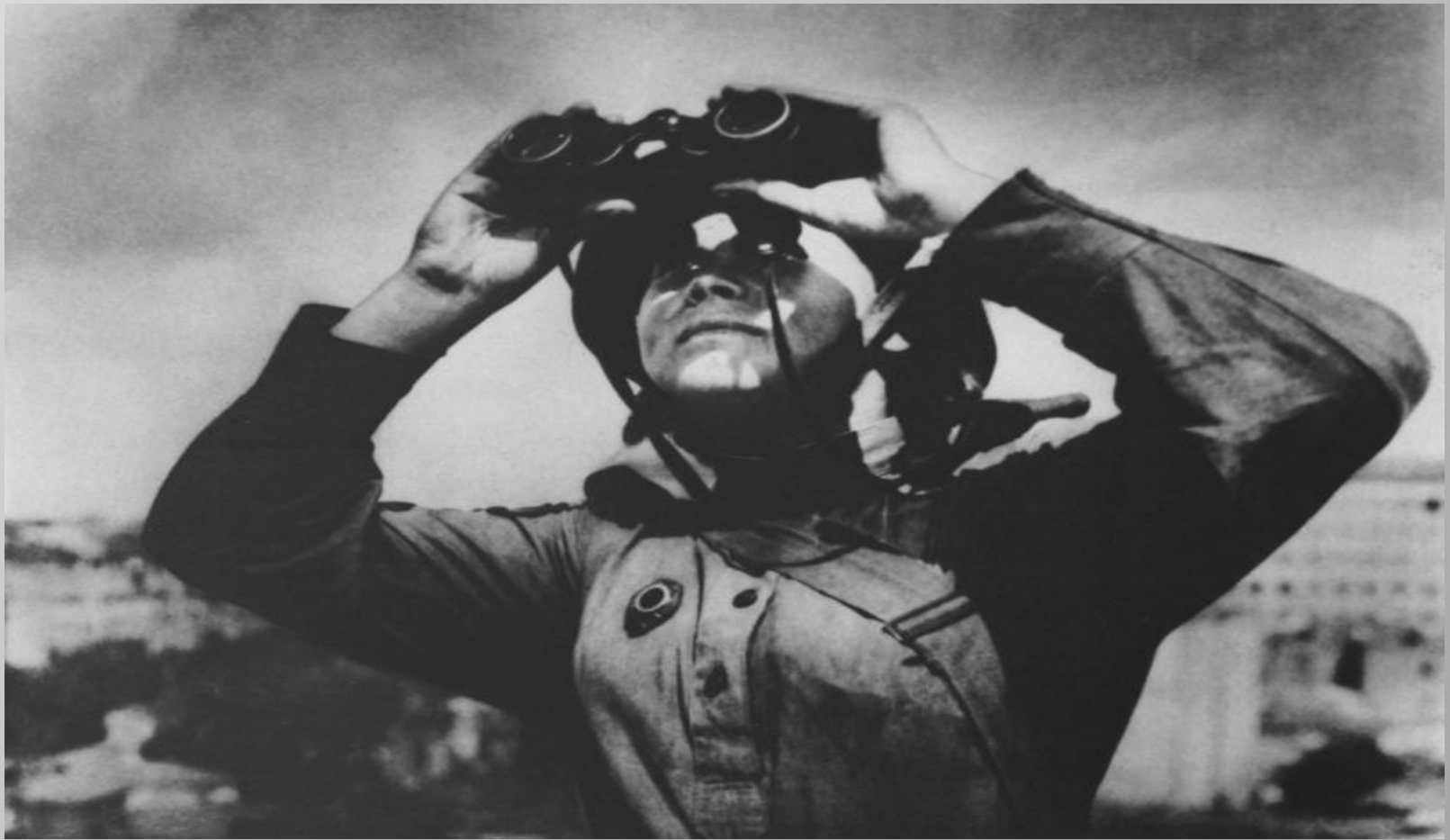
Боец противовоздушной обороны Москвы.