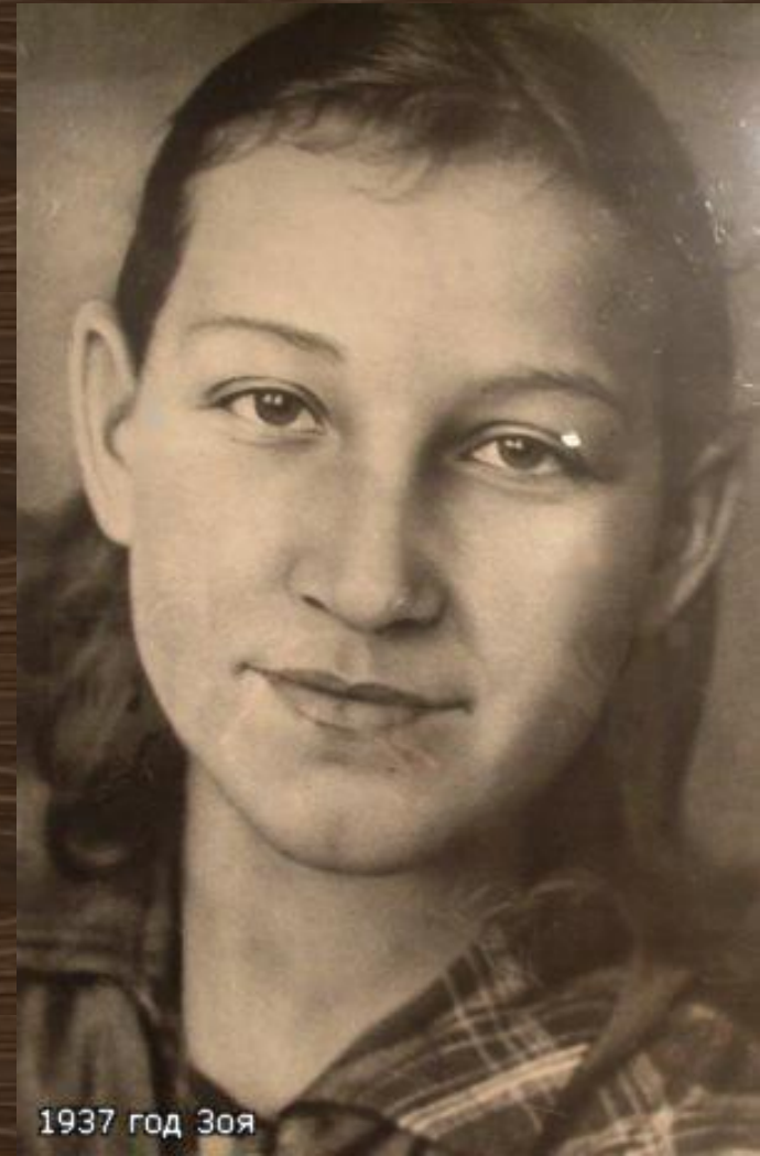
1937 год Зоя

Перед уходом на фронт, прощаясь с матерью, она сказала: «Не плачь, родная. Вернусь или умру героем...»