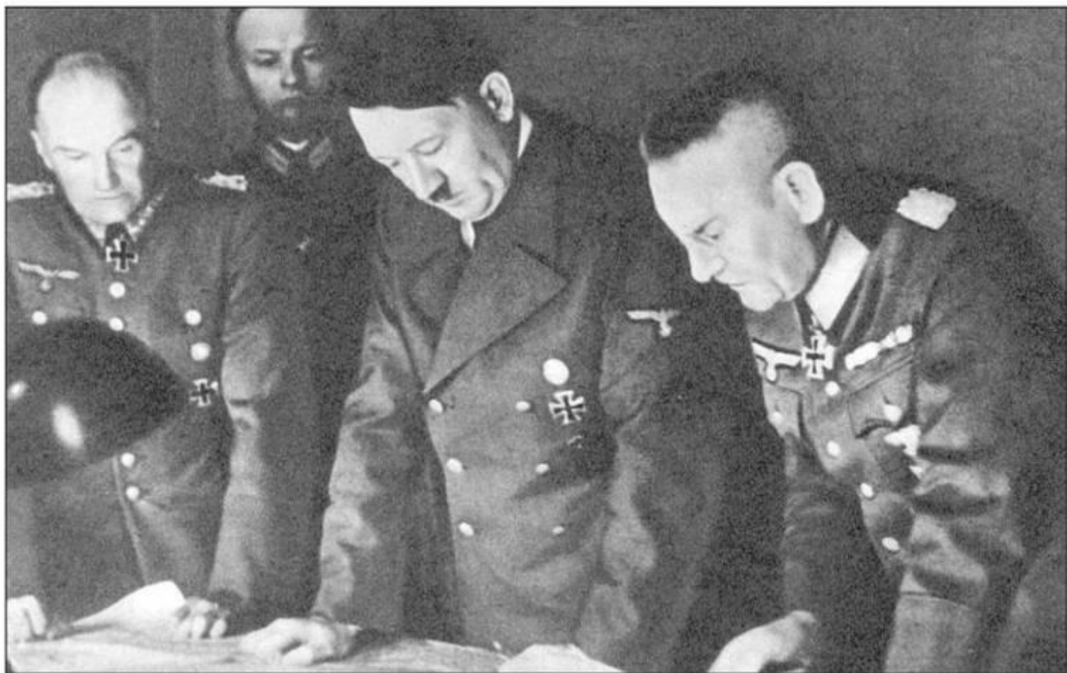
В ставке Гитлера. Слева направо в первом ряду: В.Браухич, А.Гитлер, Ф.Гальдер. 1941 год.