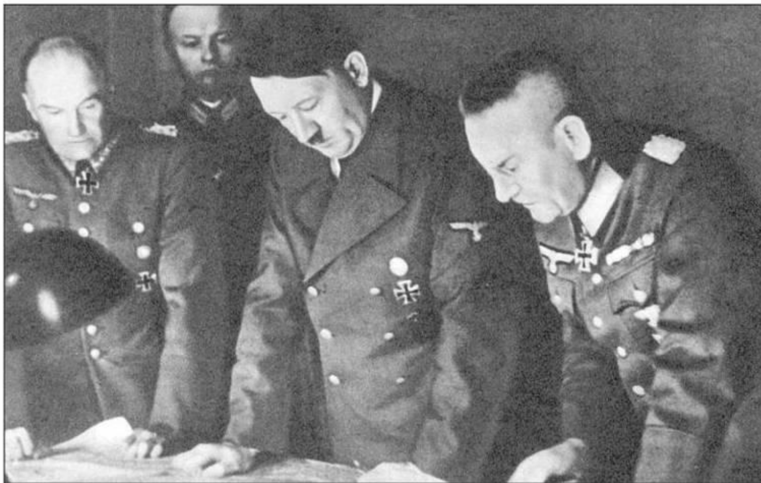
В ставке Гитлера. Слева направо в первом ряду: В.Браухич, А.Гитлер, Ф.Гальдер. 1941 год.