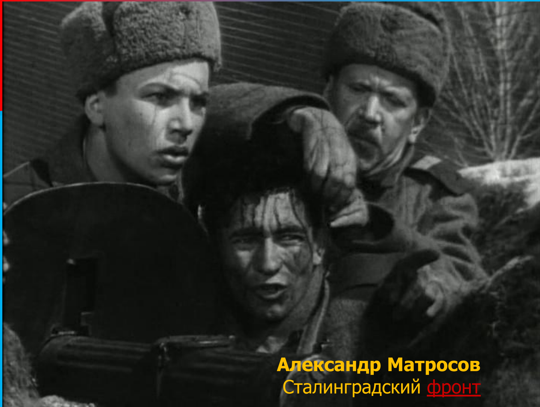
Александр Матросов Сталинградский фронт