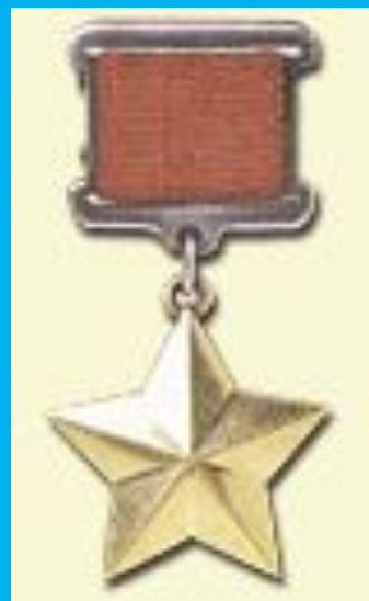
Медаль "Золотая Звезда"