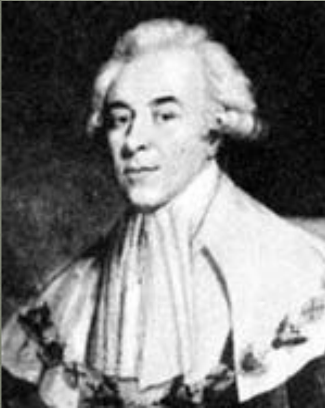
Николай Петрович Румянцев