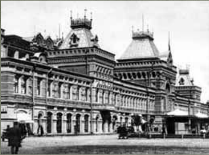
Вид на Главный дом с площади.