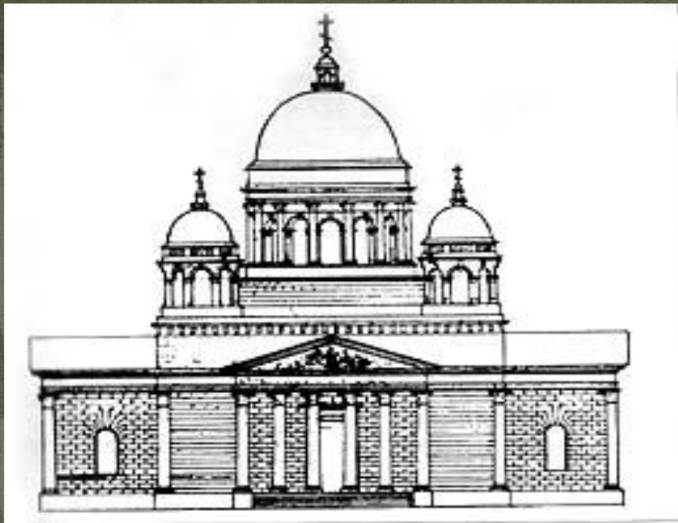
Эскиз фасада Спасского собора.