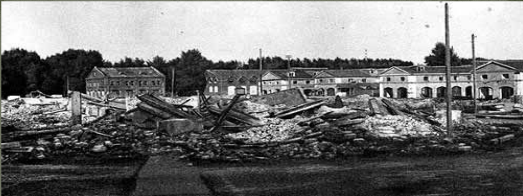
Вид на разрушенные Китайские ряды и пустующие корпуса около Спасского собора.