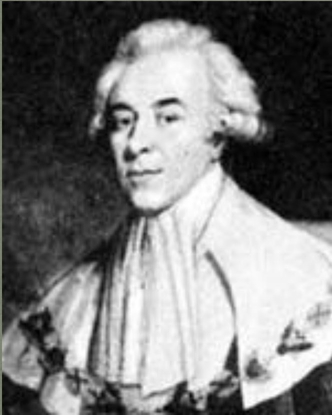
Николай Петрович Румянцев