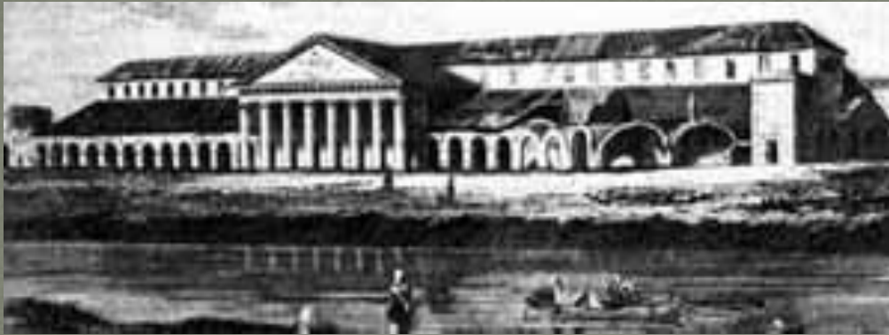
Общий вид центрального корпуса Макарьевской ярмарки.