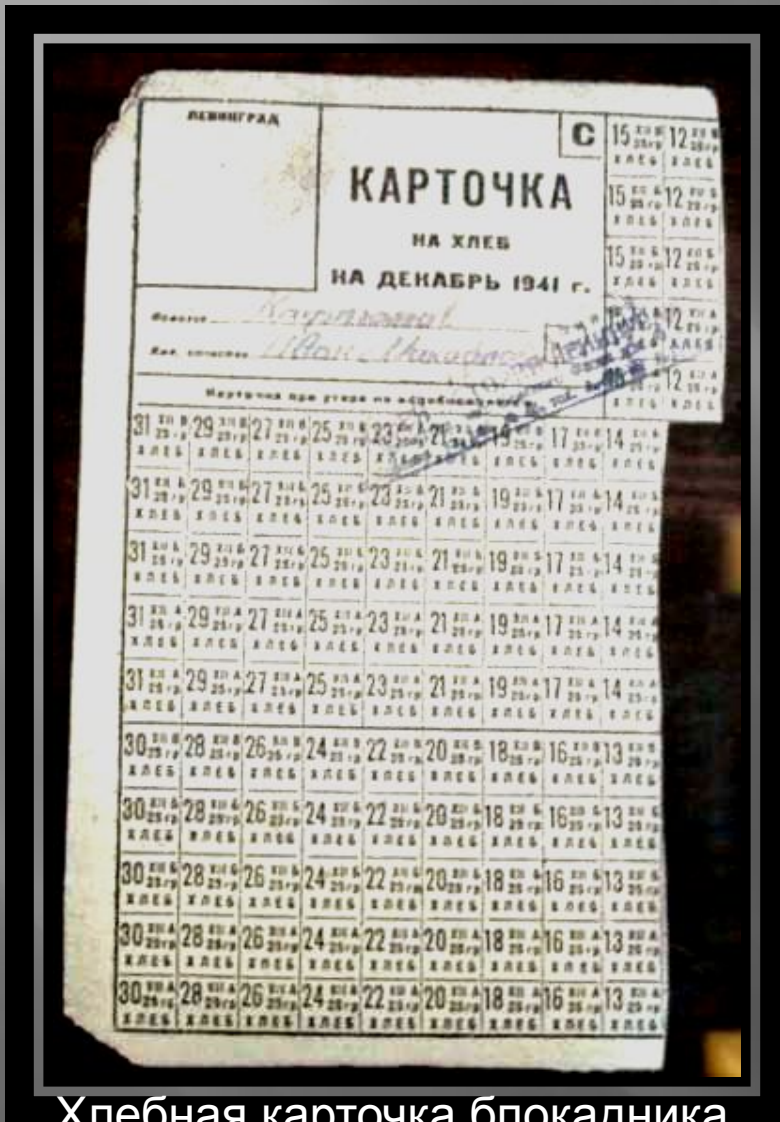
Хлебная карточка блокадника