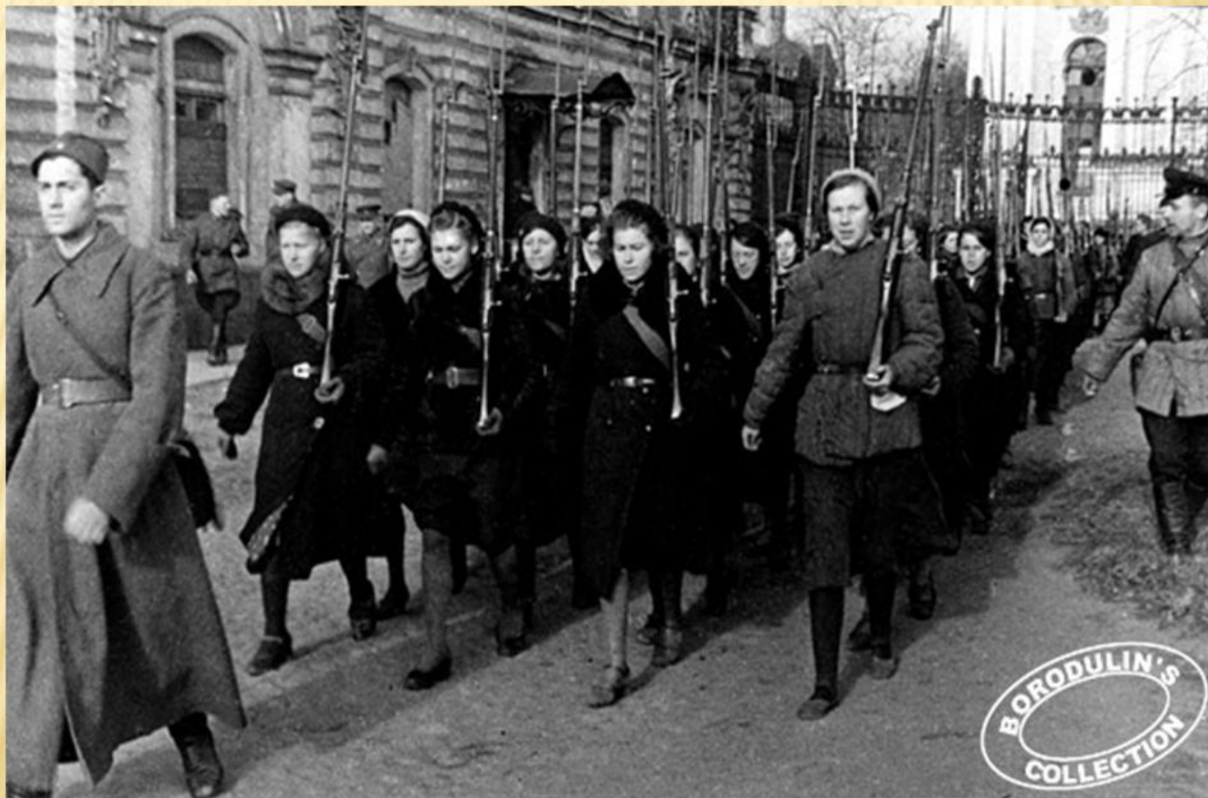
Женский стрелковый батальон.

На защиту города поднялись все его жители: 500 тысяч ленинградцев строили оборонительные сооружения, 300 тысяч ушли добровольцам в народное ополчение, на фронт и в партизанские отряды.