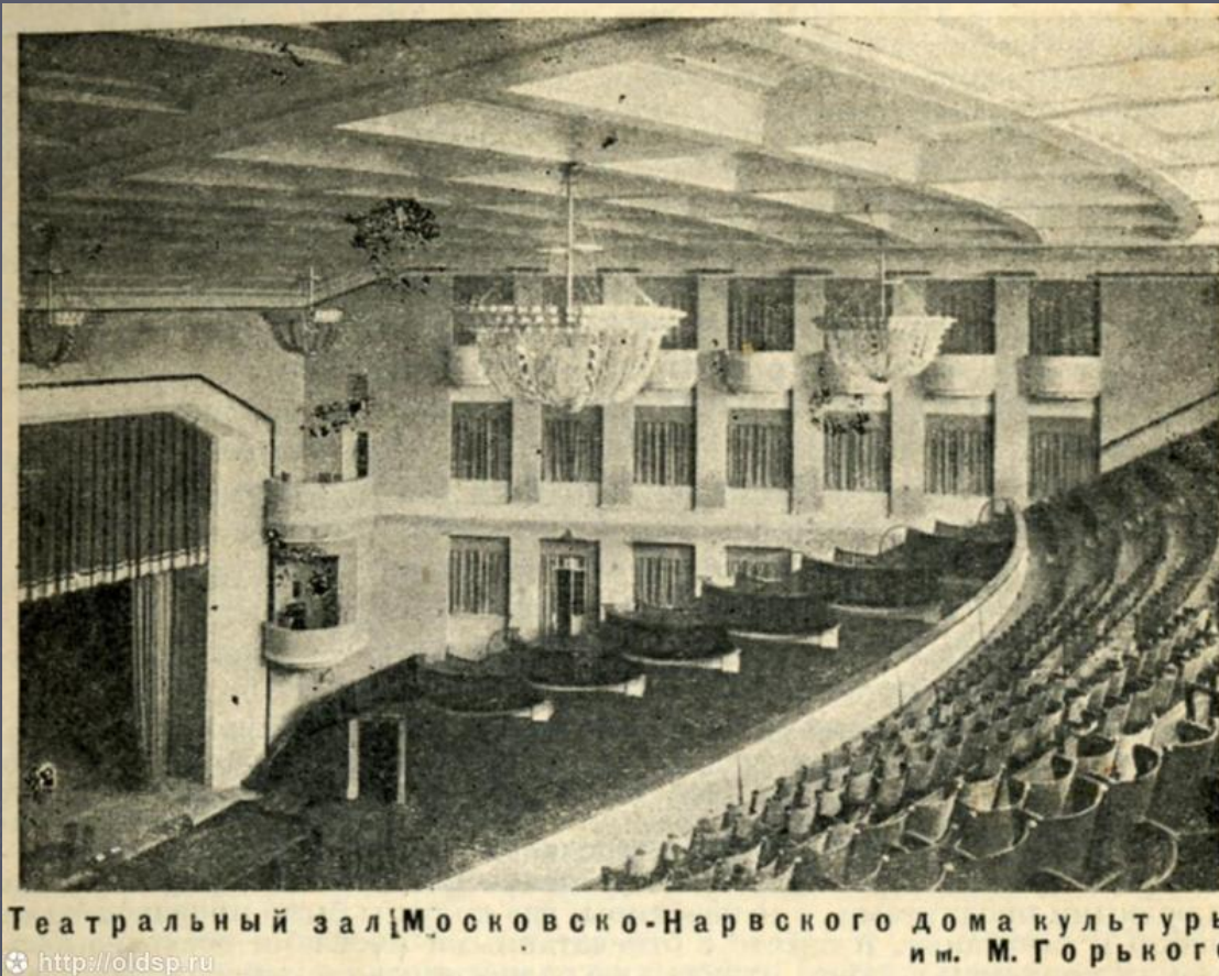
Театральный зал Московско-Нарвского дома культуры им. М. Горького