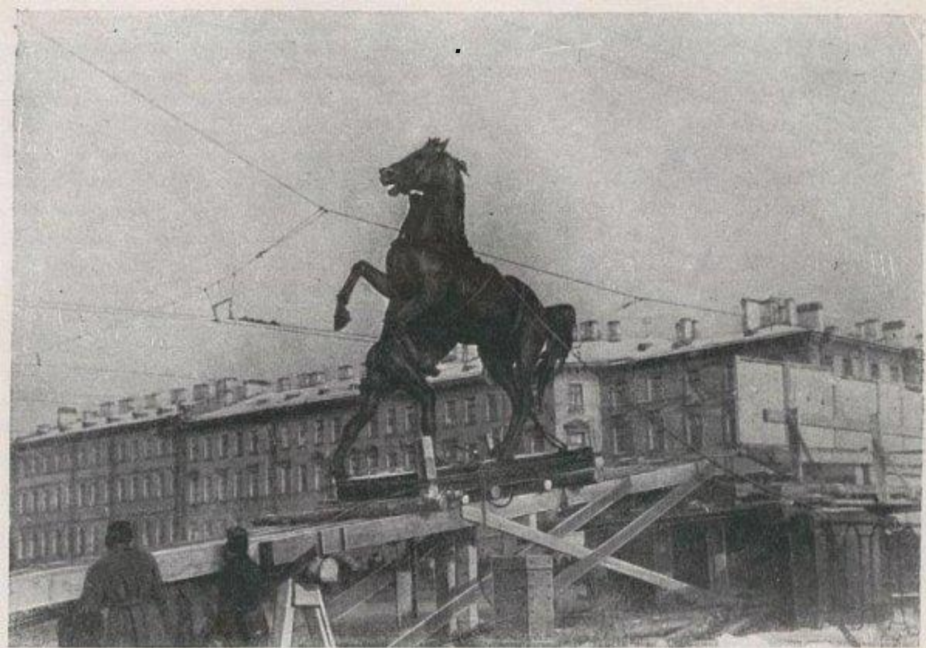
Снятие конных скульптур с Анничкова моста, 1941 г.