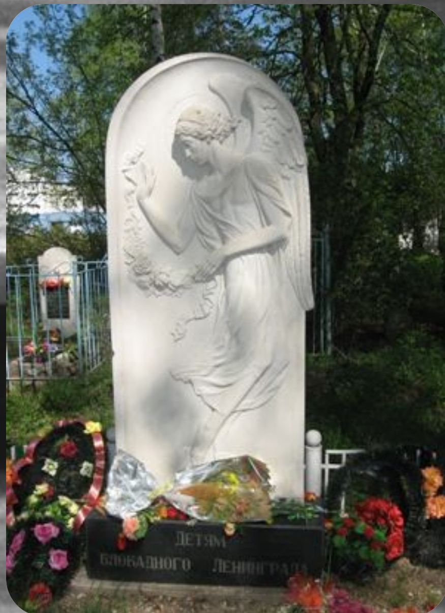
Памятник детям блокадного Ленинграда (Ярославль).