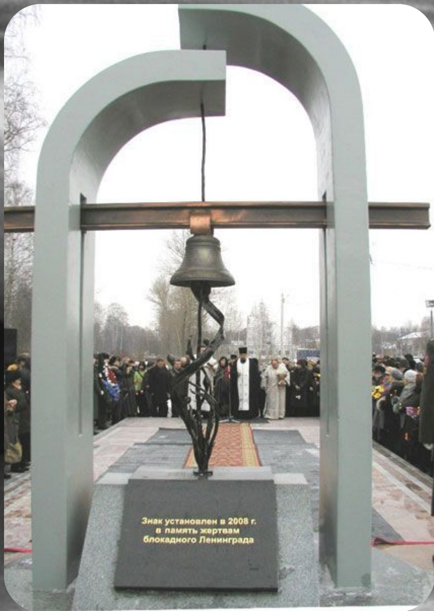
В Ярославле памятник жертвам блокадного Ленинграда.