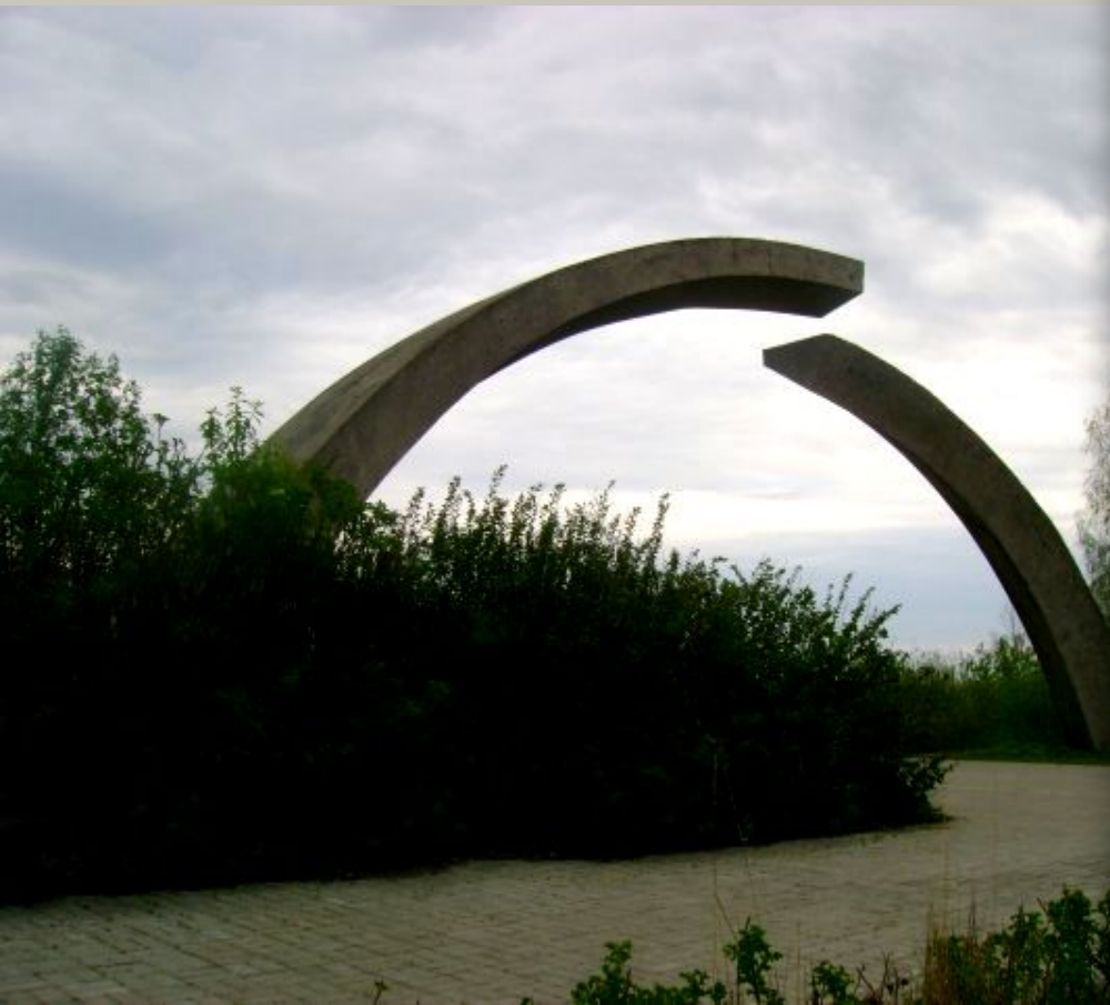
Памятник в честь разрыва блокады Ленинграда!