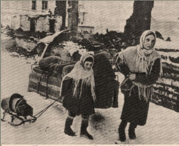
Надо искать новый кров. 1941 г.