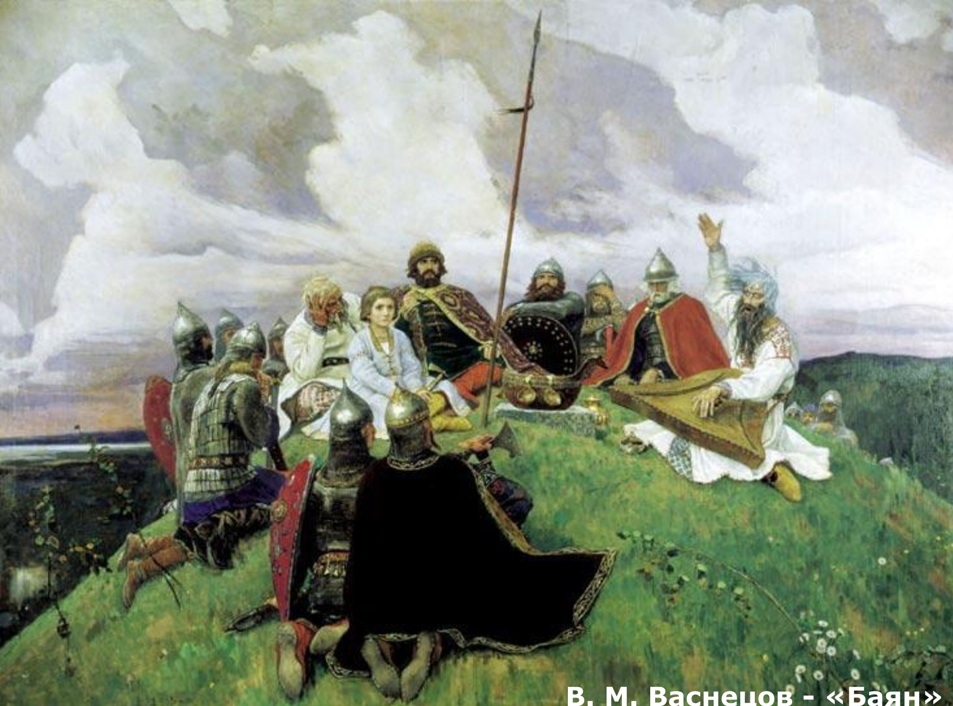
В. М. Васнецов - «Баян»