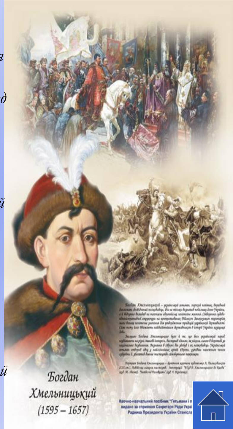
Богдан Хмельницький (1595 – 1657)

Богдан Хмельницький – український ватажок, патріот, політик, державний діяльний діяч. Він не тільки вивільнив південь і захід України, а й відіграв велику роль у становленні української державності. Сформовавши національно-визвольні сили, він здійснив велику військову перемогу над польськими військами в Берестечку, що стало переломним моментом у боротьбі за незалежність України. Після смерті Хмельницького Україна пережила 20-річний період внутрішньої війни, який стався через невдачу в переговорах з Росією та Польщею.