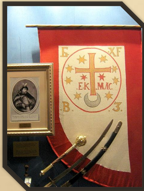
Прапор (вагувнь) Богдана Хмельцького