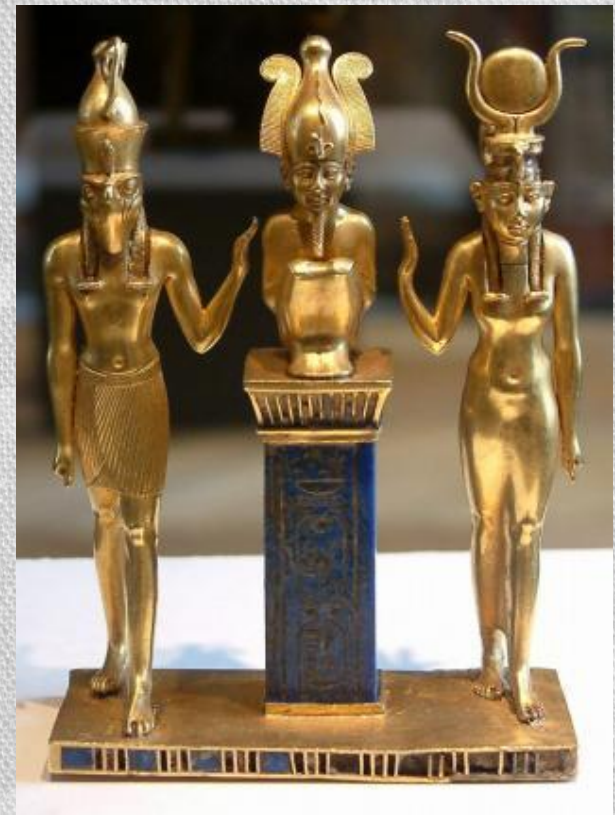
Гор, Осирис и Изида