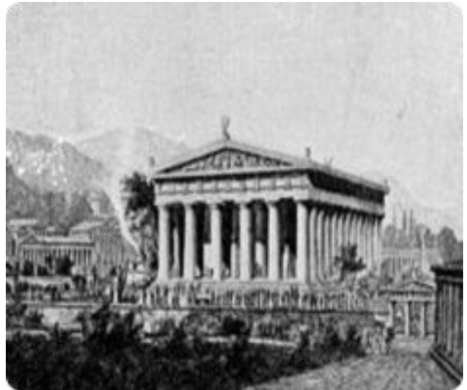
Храм и статуя Зевса в Олимпии