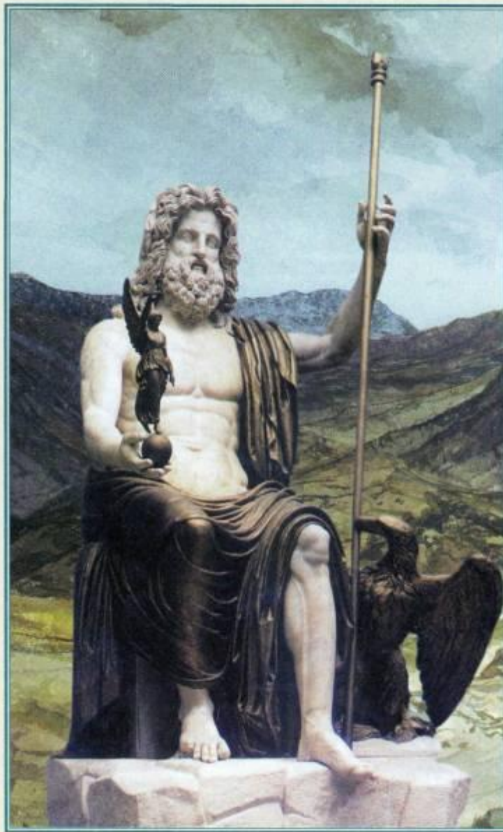
Зевс, держащий в руке богиню победы Нику Античная статуя