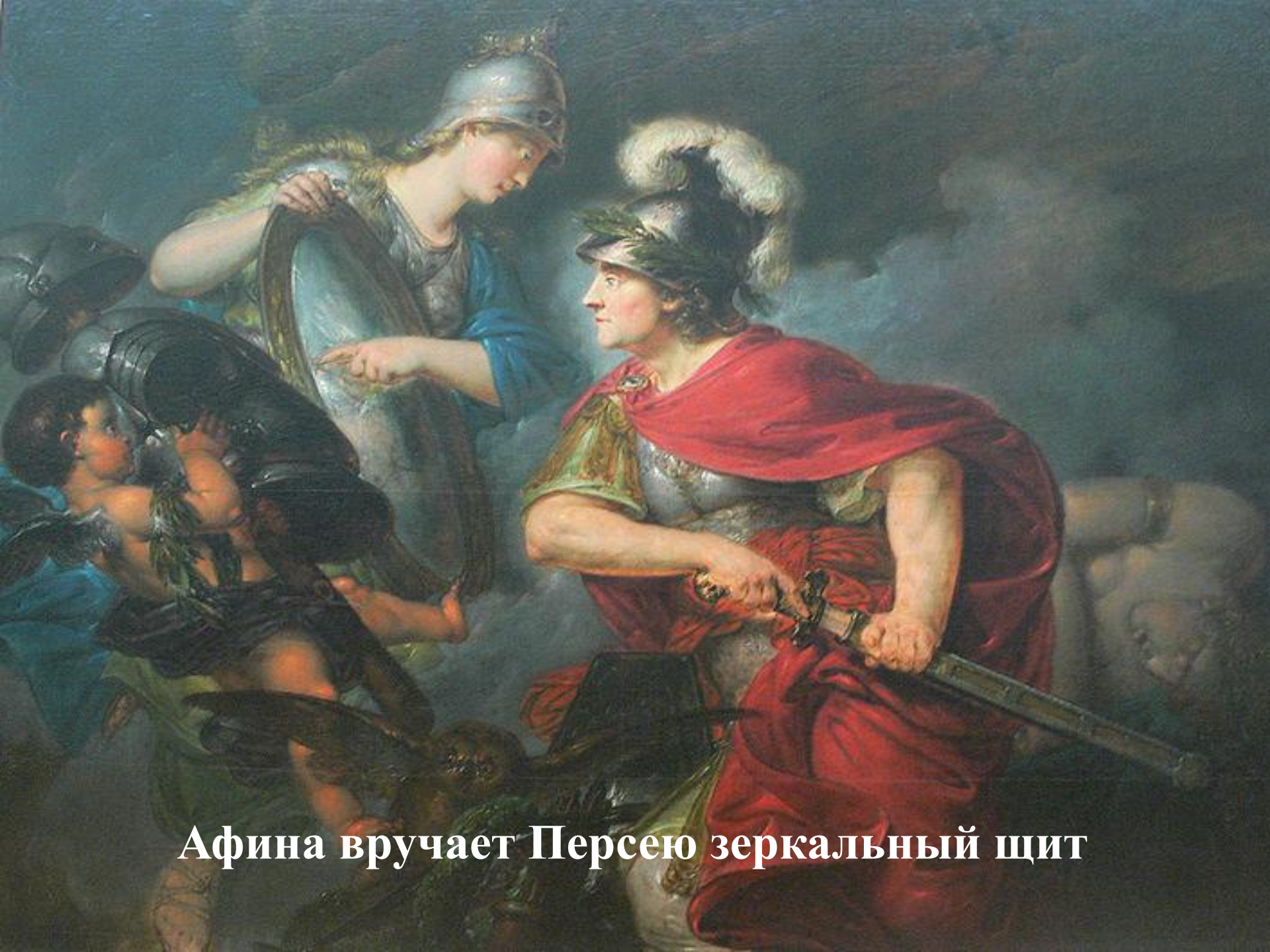
Афина вручает Персею зеркальный щит