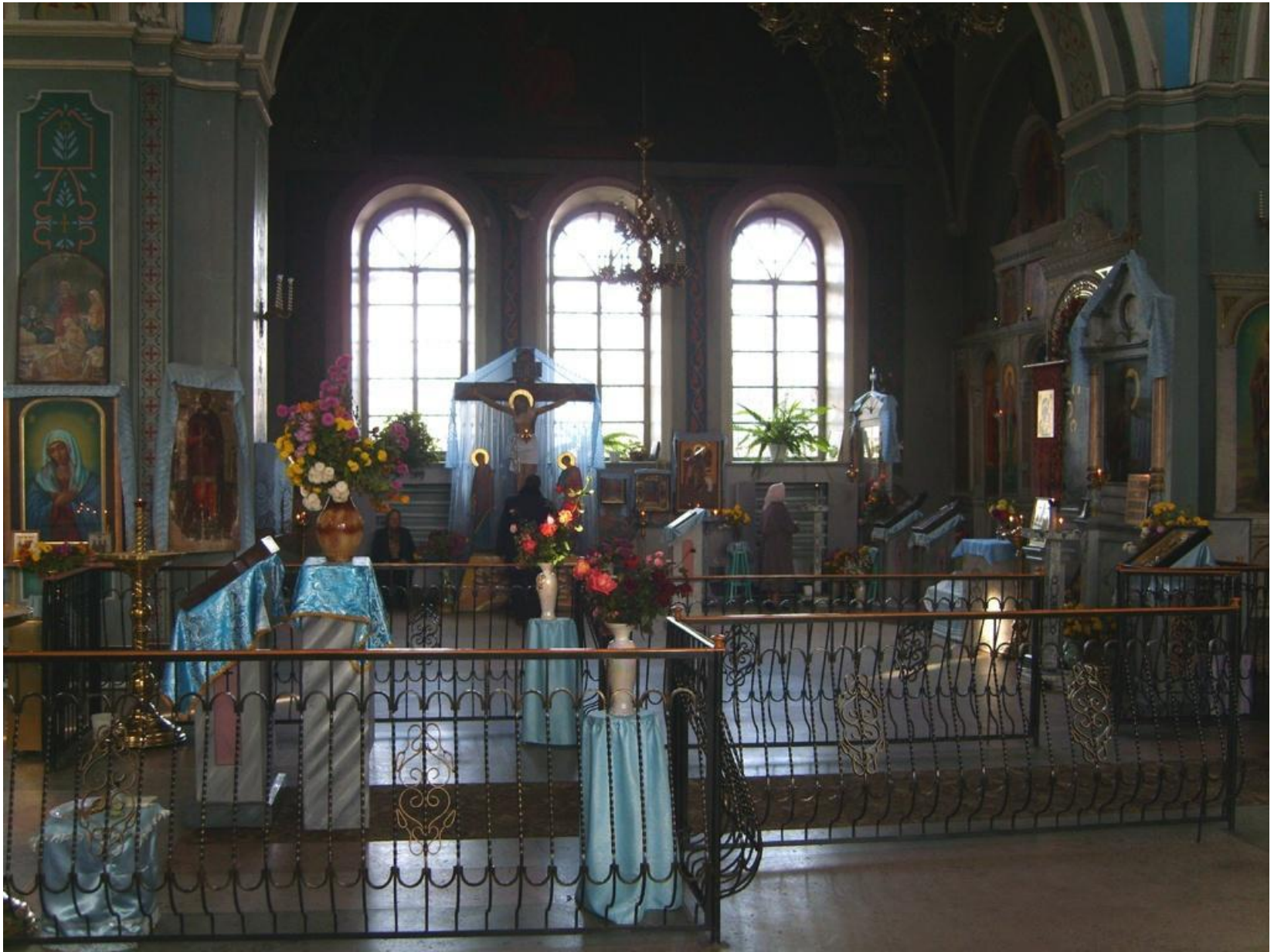
Храм Покрова в Константиновске