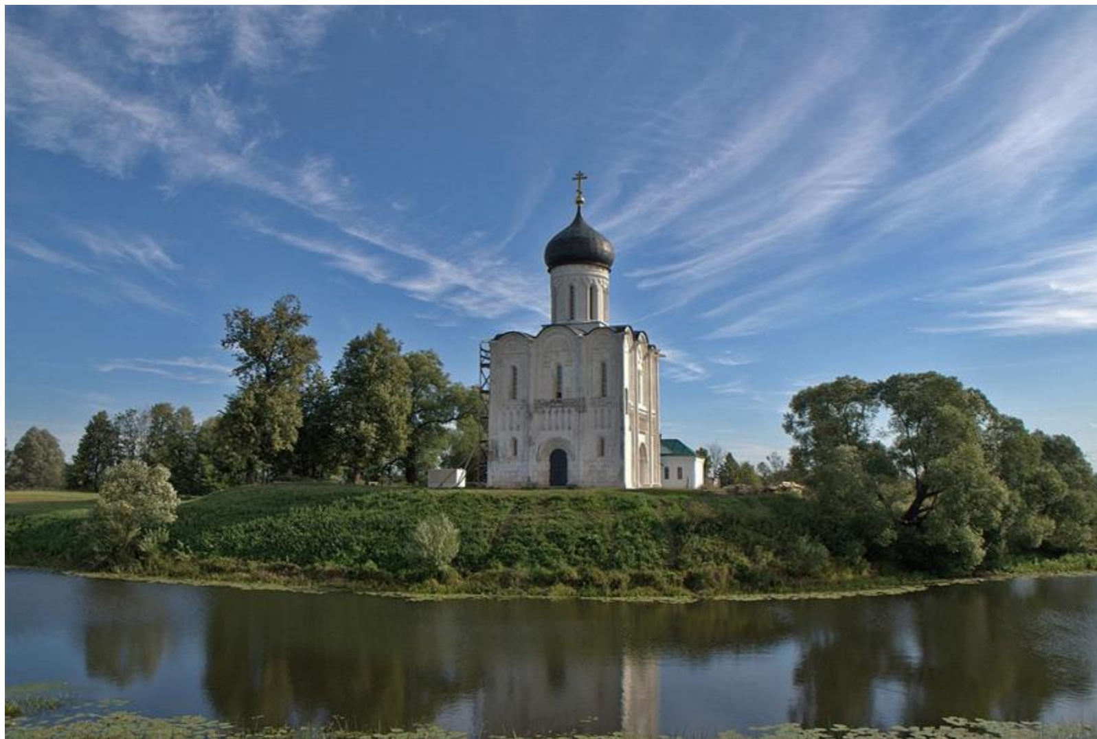
Храм Покрова на Нерли. Боголюбово