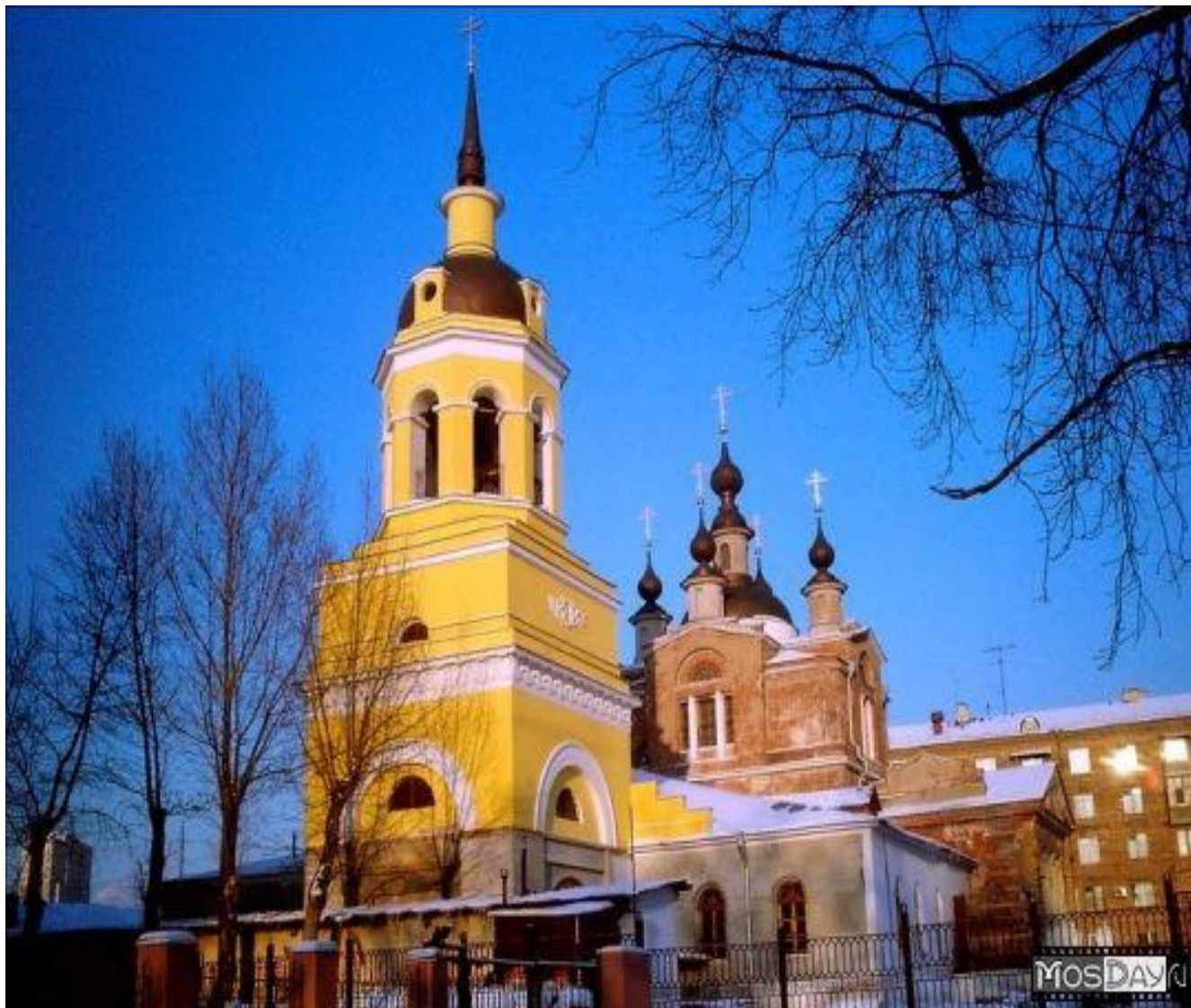
Храм Покрова в Москве