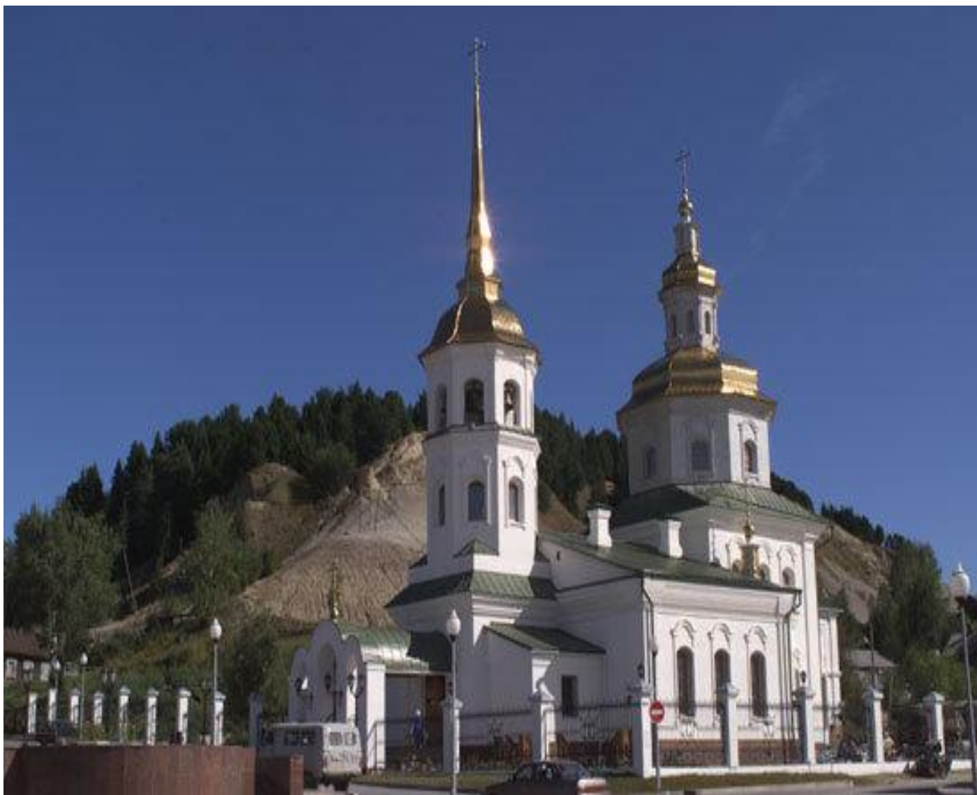
Храм Покрова г. Ханты-Мансийск